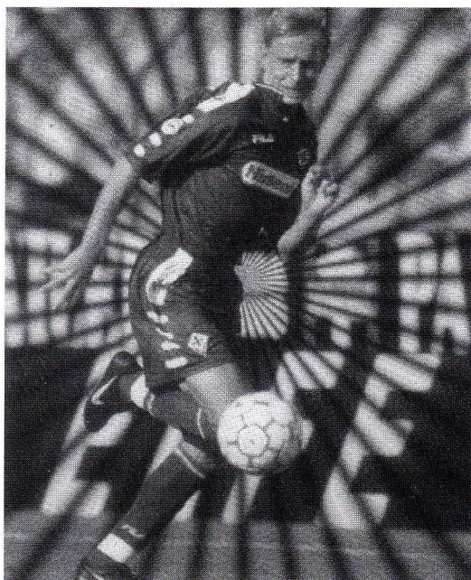
Collezione Schede Telefoniche "I Grandi Acquisti 1998-1999"

Shoot è veramente il miglior gioco sul calcio che io abbia mai provato e mi auguro che abbia il successo che merita.