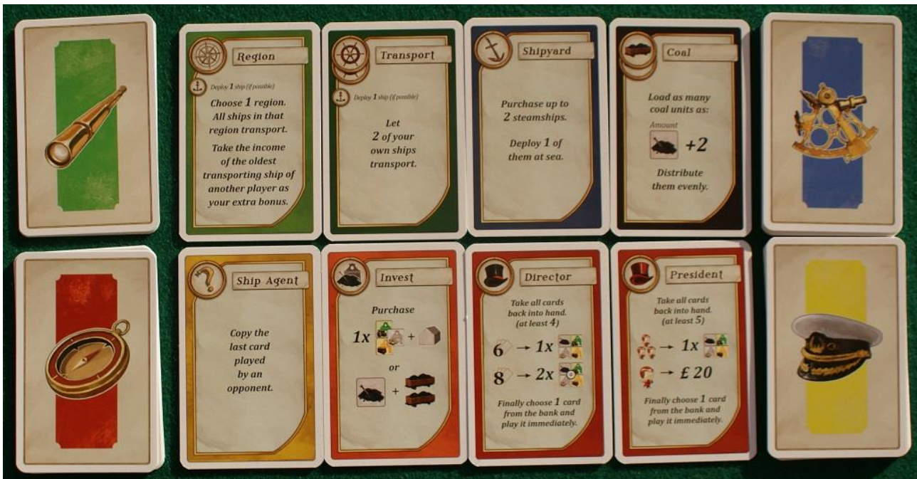
Le carte azione iniziali.