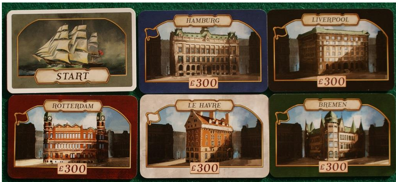
Le carte Edificio.

Queste carte vengono acquistate esattamente come le altre (una sola a turno, però) e servono soprattutto per avere un bonus extra durante il calcolo del punteggio finale.