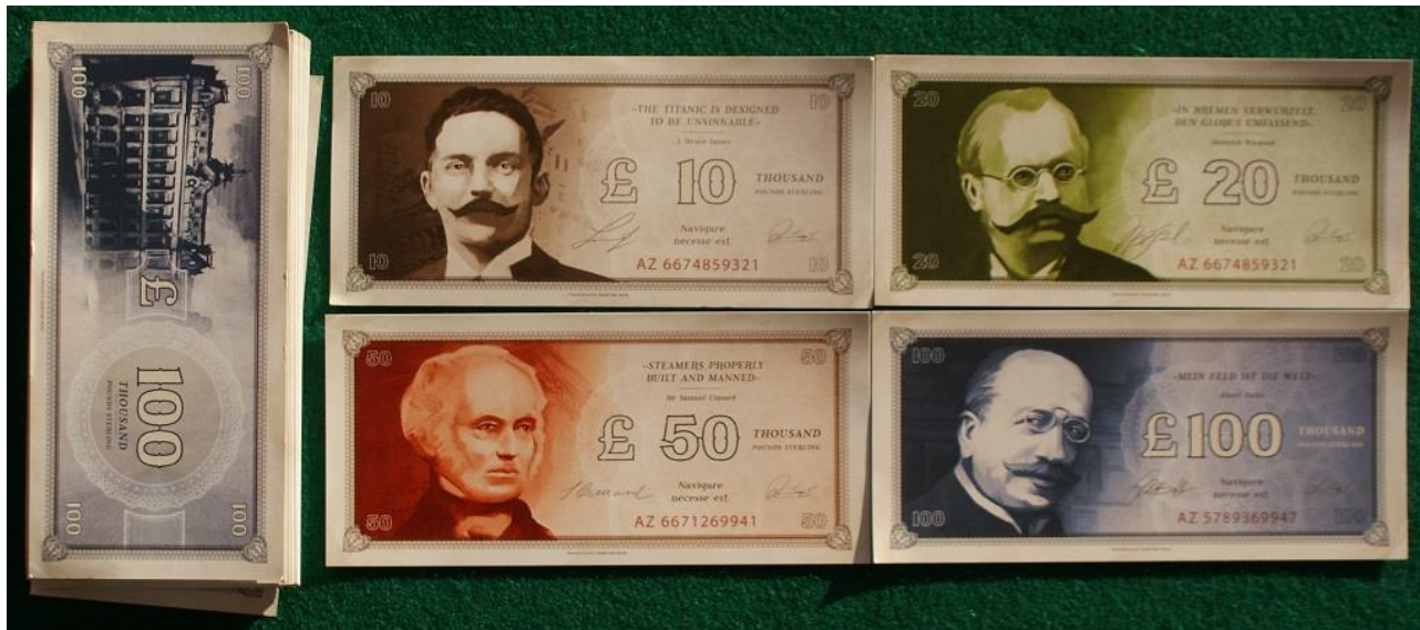
Le banconote del gioco.

Come abbiamo già detto il cuore di Transatlantic sta soprattutto nella scelta del momento migliore per l'acquisto delle navi e nel successivo collocamento in una Regione che possa garantire una vita abbastanza lunga ed una buona rendita.