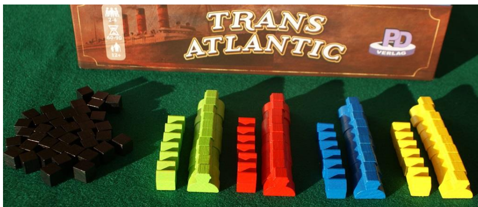
I componenti di legno colorato.

Vengono forniti anche 4 separatori di cartone robusto da sfustellare ed incastrare nella scatola per formare 6 contenitori per il materiale da gioco e sono sagomati in modo da contenere anche le varie plance rispettando l’ingombro della scatola.