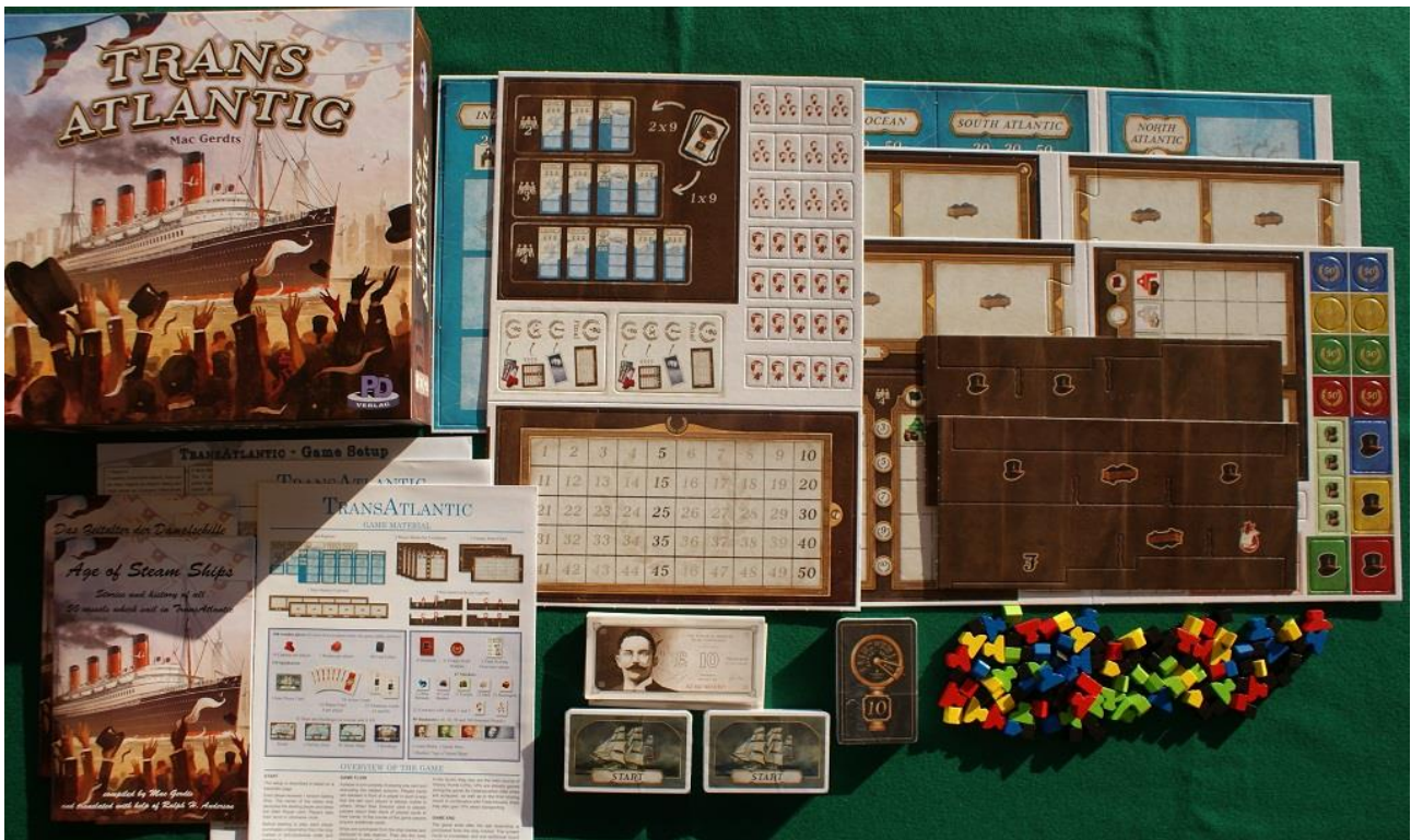
I componenti di Transatlantic.

Tutti i materiali sono robusti e di facile utilizzo: 5 plance “aree di mare”, 5 plance personali (per il gioco a 2-3-4) e la tabella per segnare i Punti Vittoria (PV) sono ricavate da cartone robusto, le 99 carte da gioco sono sufficientemente spesse (ma, al solito, consigliamo di utilizzare bustine protettive trasparenti perché se ne farà un uso intenso), le 99 tessere da sfustellare sono grandi abbastanza da poter essere manipolate senza problemi, le 80 banconote sono di grandi dimensioni (ma un po’ leggerine) e tutti i segnalini di legno colorato (un set per giocatore ed una quarantina di cubetti neri per il “carbone”) sono del tipo standard alla “tedesca” e facilmente manipolabili. Permetteteci però di fare una piccola osservazione sulle carte “nave”: esse riproducono 50 vascelli e piroscafi con illustrazioni tratte dai disegni dell’epoca in cui furono costruite e sono davvero molto belle. Durante il gioco si farà riferimento solo ai dati su di esse stampate, ma la parte grafica è davvero degna di nota e contribuisce molto a rendere l’atmosfera.