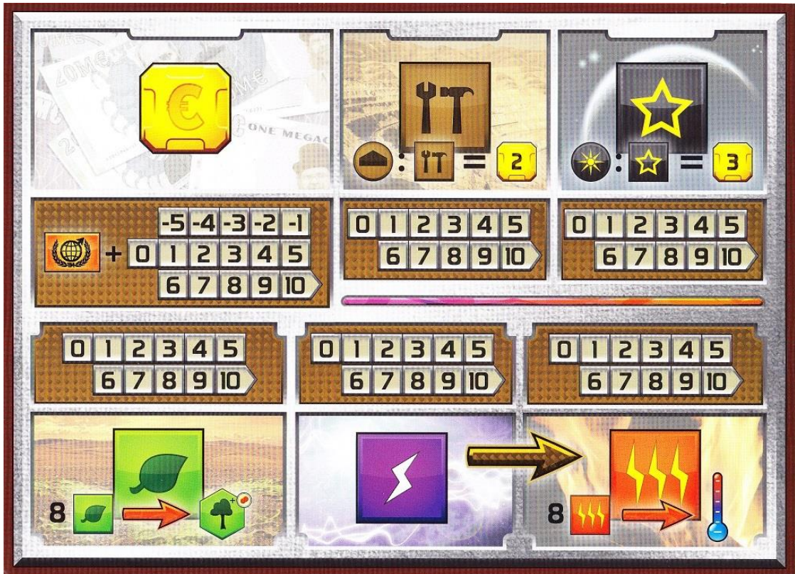
La plancia dei giocatori.

Poi ogni giocatore piazza uno dei suoi cubetti colorati sulle sei caselle "1" della sua plancia: questo valore indica le capacità di produzione iniziali della sua compagnia (soldi, acciaio, titanio, piante, energia e calore). Un altro cubetto verrà posizionato sulla casella "20" della pista "Terraforming" (il cui valore sarà utilizzato ad ogni turno per calcolare la produzione totale di soldi e, a fine partita, si sommerà al totale dei Punti Vittoria).