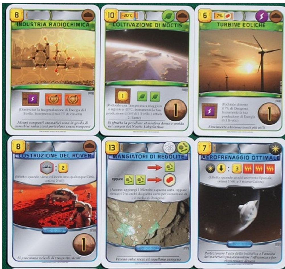
Esempio di carte Progetto.