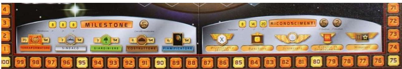
Milestones e Ricompense.

Le "Milestones" valgono 5 PV e vengono assegnate solo ai primi tre giocatori che decidono di investire in questi progetti, e cioè: arrivare alla casella 35 della pista "Terraforming"; avere già posizionato tre città sul tabellone; avere il controllo di tre foreste; avere piazzato un totale di almeno 8 costruzioni sul pianeta (città, foreste o tessere speciali); avere in mano 16 carte "Progetto". Chi raggiunge uno degli obiettivi elencati può usare un'azione per piazzare un suo cubetto sullo sviluppo prescelto (ma bisogna averlo già raggiunto prima di poter fare questa azione) pagando 8 M€.