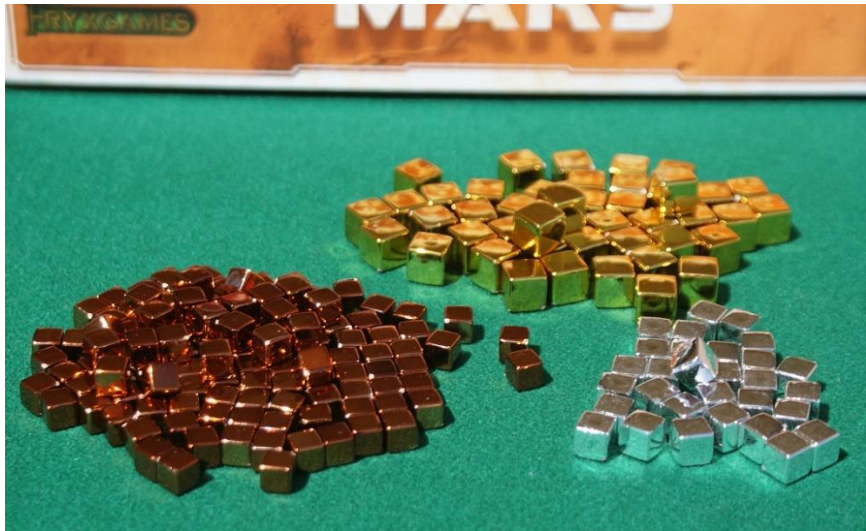
Le risorse: rame, argento e oro.

È buona norma tenere sempre gli occhi aperti sul proprio patrimonio perché senza un discreto flusso di M€ non è possibile poi investire in carte interessanti e fruttuose. A volte quindi è consigliabile non prosciugare del tutto il proprio tesoretto in un turno se nel successivo si è certi di arrivare al montante giusto per posare una carta importante. Iniziare un turno senza tanti soldi è sempre un grosso rischio, non solo perché mette i giocatori in difficoltà per giocare i Progetti più interessanti, ma anche perché rischia di limitare il numero di carte da conservare dopo il draft (ognuna di esse, lo ricordiamo, costa infatti 3 M€).