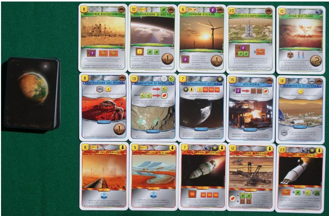
Un esempio di carte per il gioco base.

Le carte sono tutte illustrate con paesaggi marziani o spaziali e sono anch'esse molto belle, segno della cura che hanno messo nel loro gioco sia l'autore (lo svedese Jacob Fryxelius) sia l'illustratore (il fratello Isaac). Purtroppo però sono stampate su cartoncino molto leggero e, visto l'intenso uso che se ne deve fare, è praticamente obbligatorio un piccolo investimento in bustine protettive per evitare di rovinarle anzitempo. Ma stiamo pronosticando un uso così intenso solo perché Terraforming Mars è davvero un bel gioco che, ne siamo certi, giocherete a lungo.