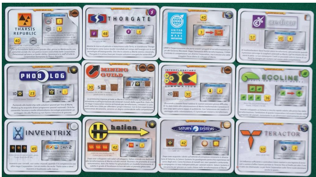
Le carte Corporation del gioco Standard.

Ogni giocatore riceve infine due carte "Corporation" (dovrà sceglierne una ed incassare quanto indicato nelle istruzioni) e 10 carte "Progetto" (e qui sarà necessario, dopo averle esaminate attentamente, decidere quante tenerne in mano e pagare 3 M€ per ognuna).