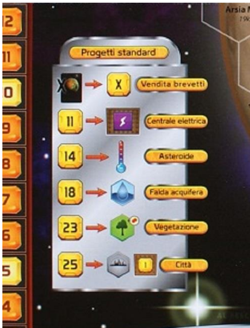
I Progetti standard

Le carte "rosse" invece rappresentano degli effetti "unici": una volta giocate ed applicato il risultato queste carte sono girate e messe da parte fino al termine della partita (ma non scartate perché alcune di loro possono assegnare PV extra a fine gioco)