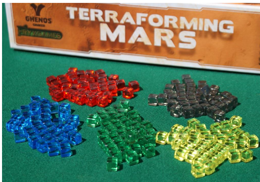
I cubetti marcatori dei giocatori.

Il primo turno di gioco spesso fornisce indicazioni importanti: si hanno infatti ben 10 carte in mano ed una discreta somma di Megacrediti da spendere. Quindi bisogna fare delle scelte sul tipo e sul numero di carte da conservare: tenere 4-5 carte (spendendo quindi 12-15 M€) è molto spesso la soluzione migliore perché permette di avere ancora i fondi per investire su un paio di Progetti di basso costo (che però dovrebbero fare aumentare qualche produzione) e tenendo magari a disposizione per i turni successivi 1-2 carte costose (ma davvero interessanti) che non possiamo permetterci in quel momento ma che senz'altro torneranno utili in seguito. Scartarle solo perché non si è in grado di pagarle subito è sicuramente un errore.