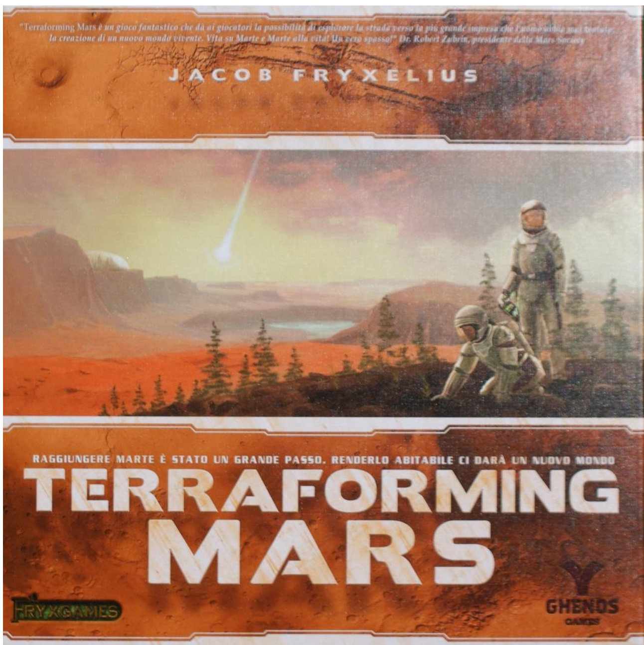
La scatola del gioco.

Quindi spendere soldi nelle Ricompense va bene solo se si ha la certezza (o quasi) di arrivare primi in quella categoria o, nel peggiore dei casi, secondi.