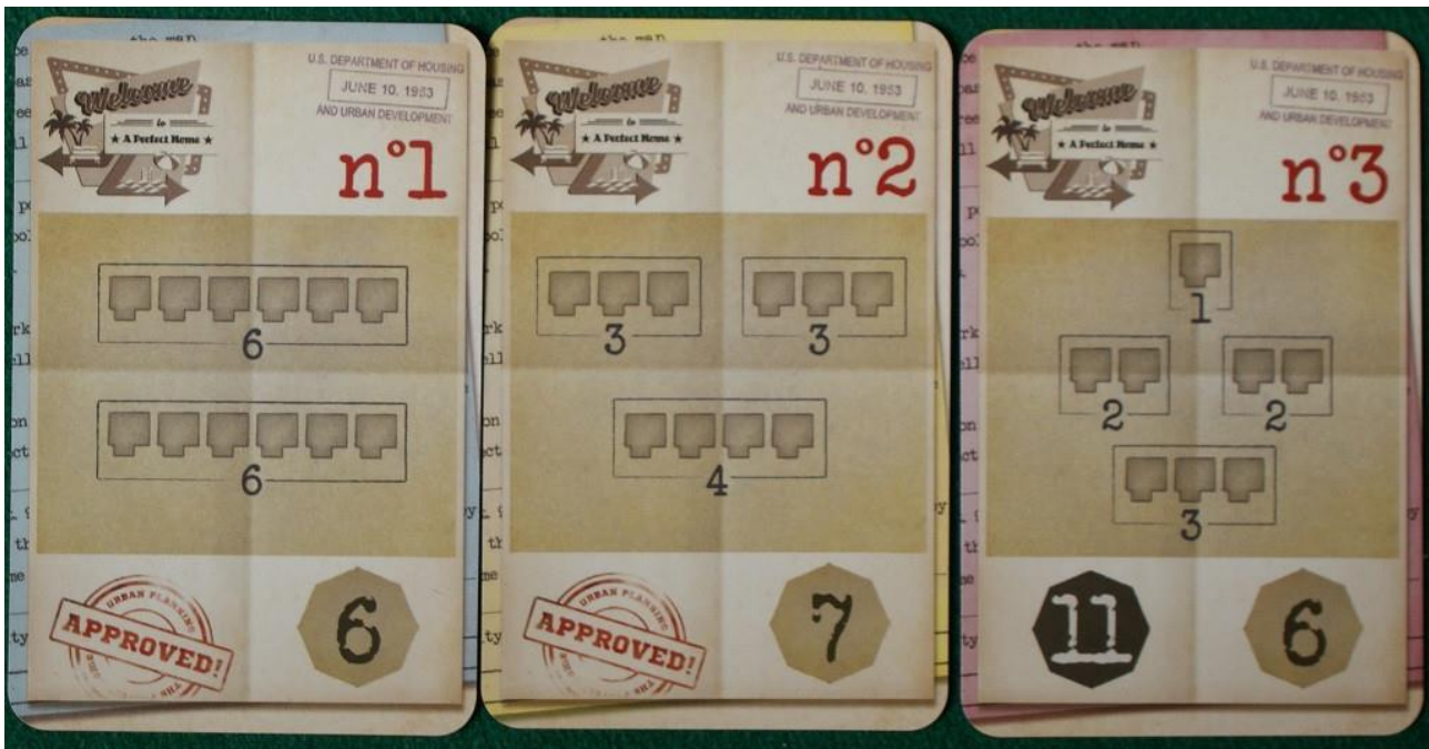
Alcune carte Progetto Urbanistico.

Per prima cosa si verifica quanti progetti urbanistici sono stati soddisfatti: le carte relative (ne vedete tre qui sopra, fotografate all'inizio di una partita) sono divise in tre sezioni: