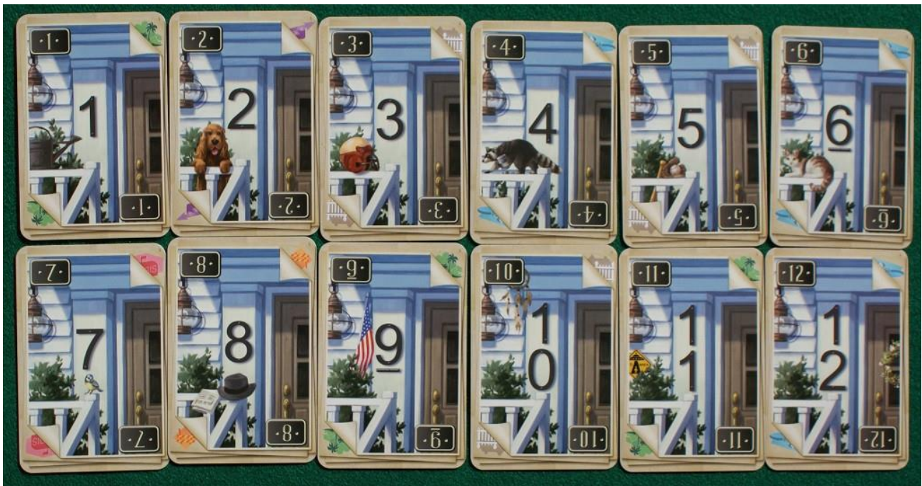
Le carte costruzione viste dal lato con i numeri civici.

Esse sono stampate su entrambi i lati: da una parte ci sono i numeri civici (li vedete nella foto qui sopra) e dall'altra sono stampati dei disegni colorati che rappresentano diverse azioni facoltative.