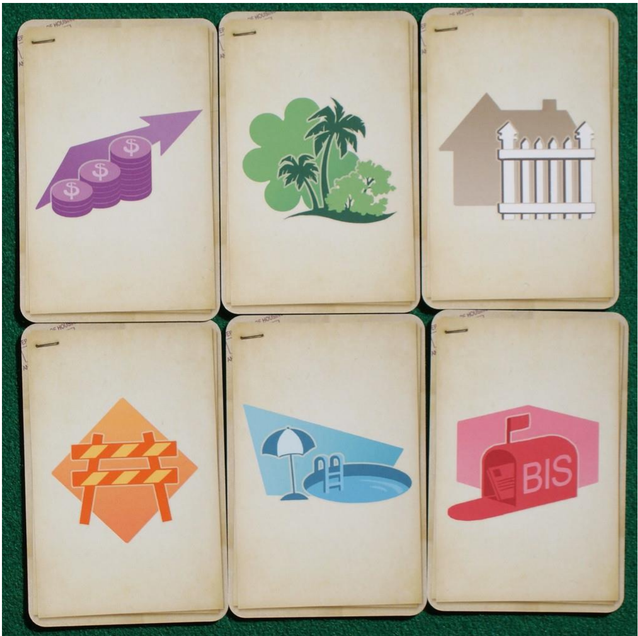
le carte costruzione viste dal lato “azione”.

Scelto il numero civico il giocatore deve subito decidere se usare l’azione abbinata a quel numero oppure passare. Ecco cosa significano i vari disegni (facendo riferimento alla foto qui sopra e partendo dalla prima carta in alto a sinistra):