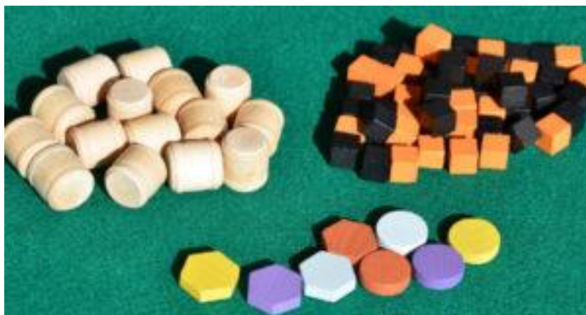
Ferro e carbone a destra, birra a sinistra ed altri marcatori.

Completano la confezione due sacchetti di cubetti che rappresentano nel gioco il “ferro” (di uno strano colore arancione) ed il carbone (cubetti neri); un altro sacchetto contiene la “birra” (sotto forma di piccoli barili di legno) da utilizzare per certe transazioni; completano la dotazione due manciate di monete (da 1, 5 e 15 sterline) ed alcune tessere speciali. Una vera gioia per gli occhi degli appassionati. Il libretto delle regole, tradotto in italiano da Ghenos Games, è uno dei più completi che abbiamo mai visto e contiene disegni ed esempi per ogni concetto spiegato, oltre ad una serie di note storiche, alla biografia dei magnati dell’epoca e ad alcuni consigli strategici.