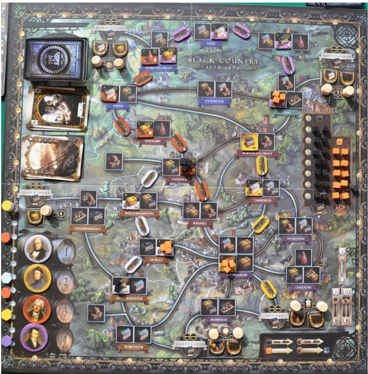
Partita in corso.

Non stiamo qui ad annoiarvi con la ripetizione di tutte le regole di Brass Birmingham (per questo potete andare a rilegervi l’articolo di Lorenz Rodà già pubblicato ) ma riportiamo comunque qui di seguito un veloce riassunto della sequenza di gioco.