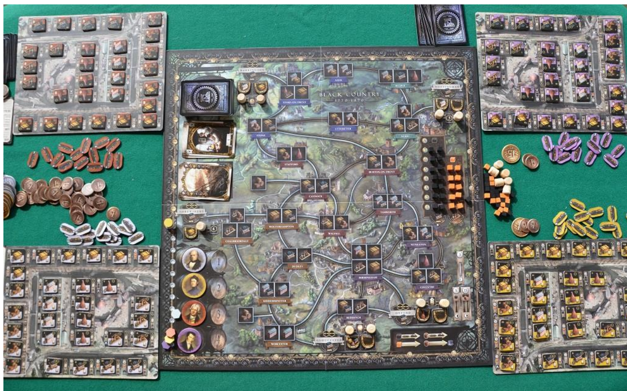
Il tavolo pronto per una partita a quattro.

Per giocare a Brass Birmingham serve un tavolo abbastanza grande, non solo per il tabellone, ma anche per le plance individuali che sono piuttosto ingombranti. Dopo aver scelto se giocare di “giorno” o di “notte” il tabellone viene equipaggiato con una serie di cubetti che rappresentano il ferro ed il carbone da piazzare in un’apposita griglia sulla mappa (chiamata “mercato”).