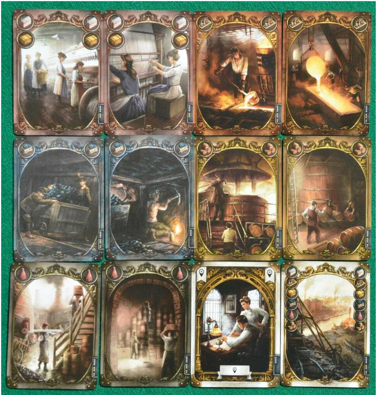
Alcune carte “industria”.

Alla fine del turno i giocatori ripristinano la loro mano pescando carte dal mazzo fino ad averne di nuovo otto.