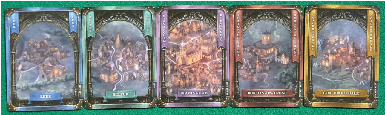
Alcune delle carte "Città".

In base alla posizione del loro segnalino sul tracciato delle rendite, all'inizio di ogni turno tutti incassano una certa cifra e la sequenza ricomincia da capo. La partita finisce dopo aver terminato l'Epoca delle Ferrovie e chi ha in quel momento il più alto valore di PV è dichiarato vincitore.