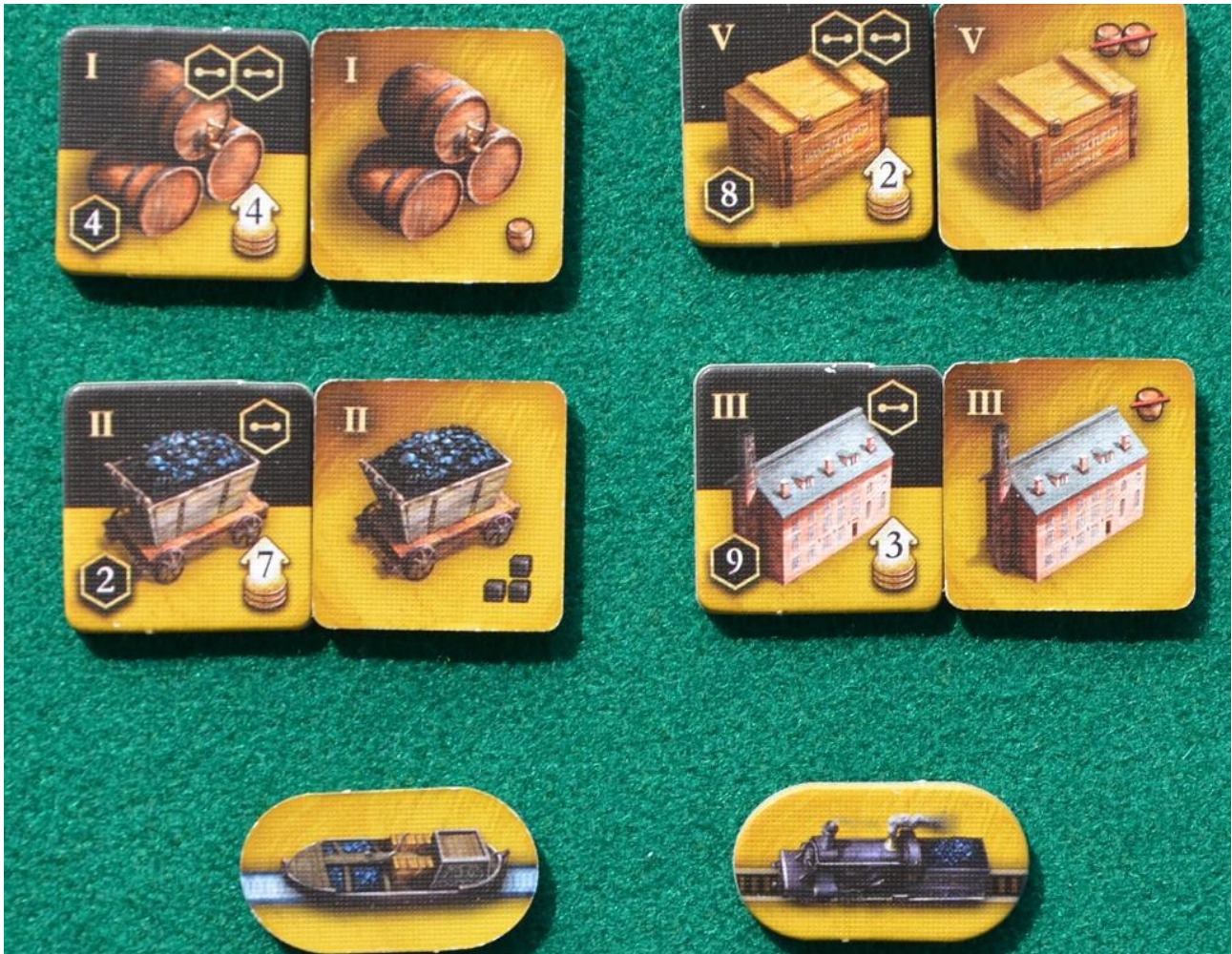
Dettaglio delle nuove tessere.

Nel caso di Brass Birmingham la risposta è un po' articolata: a nostro avviso chi ha l'edizione originale della Tree Frog potrebbe evitare di acquistare l'edizione "Brass Lancashire" perché, tutto sommato, le regole non sono cambiate di molto. Tuttavia la grafica è stata enormemente migliorata e le regole sono state ottimizzate al punto che noi non abbiamo potuto fare a meno di procurarci la nuova edizione.