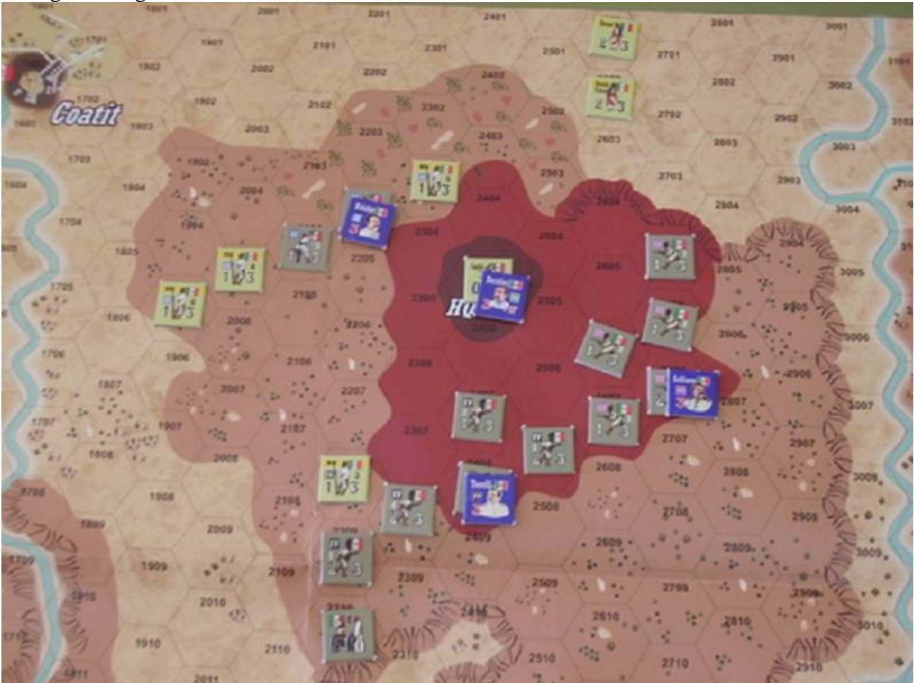
Dettaglio battaglia di Coatit