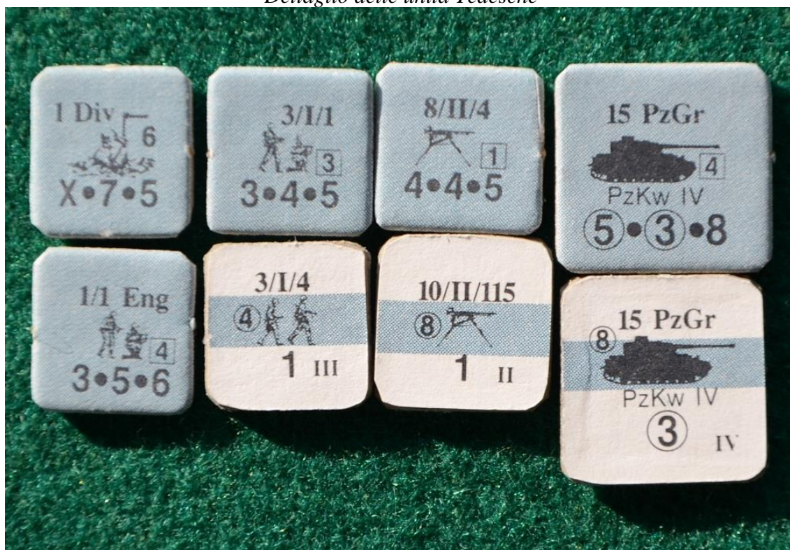
Dettaglio delle unità Tedesche

Tutti i combattenti hanno due facce: quella anteriore (chiamata “uncommitted” nel testo) mostra i dati dell’unità rappresentata (unità di appartenenza, fattore di attacco e di difesa, movimento e valore nel combattimento corpo a corpo) mentre sul retro (“committed”) resta un solo dato: il fattore di Difesa. Questo perché la meccanica del gioco si basa appunto sulla possibilità che le unità siano “fresche e in allerta”, pronte a difendersi o a sparare sul nemico (lato “A”) oppure affaticate e quindi più deboli se contrattaccate (Lato “B”).