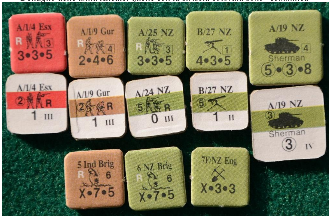
Dettaglio delle unità Alleate: quelle con la striscia colorata sono "committed"

Tutti i combattenti hanno due facce: quella anteriore (chiamata “uncommitted” nel testo) mostra i dati dell’unità rappresentata (unità di appartenenza, fattore di attacco e di difesa, movimento e valore nel combattimento corpo a corpo) mentre sul retro (“committed”) resta un solo dato: il fattore di Difesa. Questo perché la meccanica del gioco si basa appunto sulla possibilità che le unità siano “fresche e in allerta”, pronte a difendersi o a sparare sul nemico (lato “A”) oppure affaticate e quindi più deboli se contrattaccate (Lato “B”).