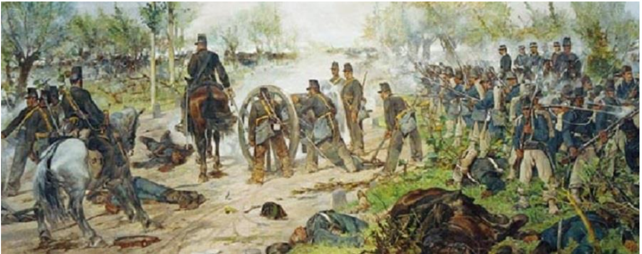
La battaglia di Custoza in un dipinto di Giovanni Fattori.

Abbiamo già avuto l'occasione di parlare del "Risorgimento" italiano, una delle pagine più gloriose della storia del nostro Paese, in occasione della recensione di Goito: una vittoria inutile ed oggi abbiamo il piacere di presentarvi un'altra battaglia di quel periodo.