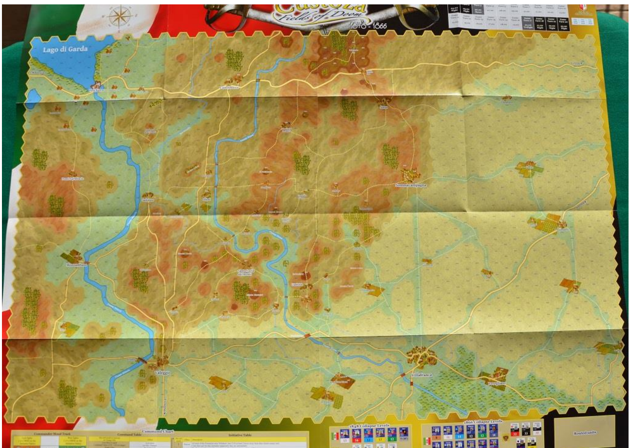
La grande mappa di Custozza.

Le unità impegnate ma non attivate possono però togliere 2 punti di affaticamento alla loro formazione, così come quelle “in marcia” che restano ferme sul posto o quelle in riserva. Le unità troppo affaticate possono perdere di incisività (si lancia un dado e se il valore è uguale o inferiore al livello di fatica raggiunto si piazza un segnalino “Fatigue”) e riceve quindi dei malus nella fase di combattimento.