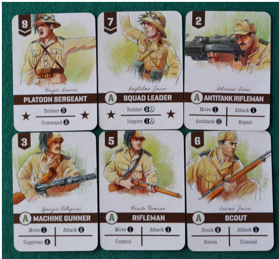
Un esempio di carte del giocatore italiano.

Le carte restano il vero motore anche in Undaunted: North Africa , ma se si differenziano un po' da quelle del primo gioco, visto che, oltre ai soliti Sergente, Leader, Fucilieri, Scout, Fucilieri e Mitraglieri qui abbiamo un aereo da ricognizione, dei "carristi" e dei fucili anticarro per gli italiani mentre i Britannici (i famosi Scorpioni del Deserto) hanno una migliore leadership, dei Sabotatori, dei Genieri e, naturalmente, gli anticarro.