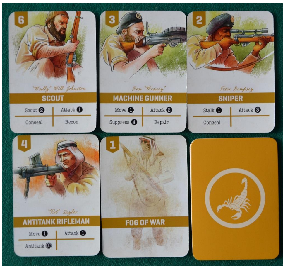
Alcune carte del giocatore Britannico.

Per avanzare verso un terreno "obiettivo" in Undaunted: North Africa è quasi sempre necessario eliminare la resistenza del nemico facendo ritirare le sue unità o, in caso di difesa coriacea, eliminandole definitivamente con una serie di tiri. Per calcolare come colpire il nemico bisogna innanzitutto stabilire il suo valore "Difensivo", sommando al numero stampato sul gettone quello del Terreno occupato. Poi si lancia il numero di dadi specificato sulle armi utilizzate e si applicano i risultati (se ci sono "colpi a segno")