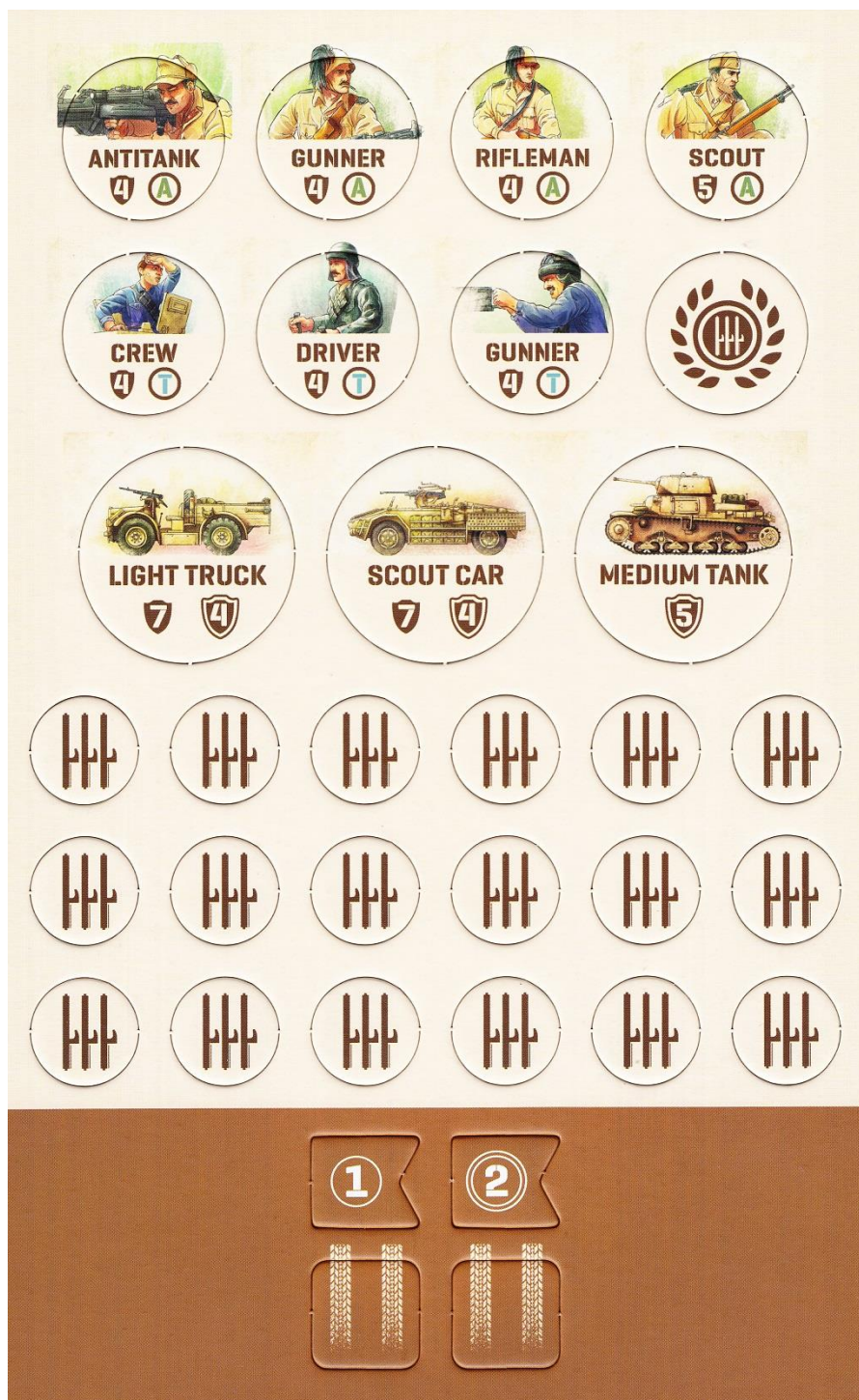
Gettoni e tessere per il giocatore Italiano.

Ogni gettone corrisponde ad uno dei soldati delle varie squadre (A-B-C) o ad una unità speciale ed, oltre al nome ed alla squadra di appartenenza, riporta un valore “numerico” (da 4 a 6) che indica la forza in difesa.