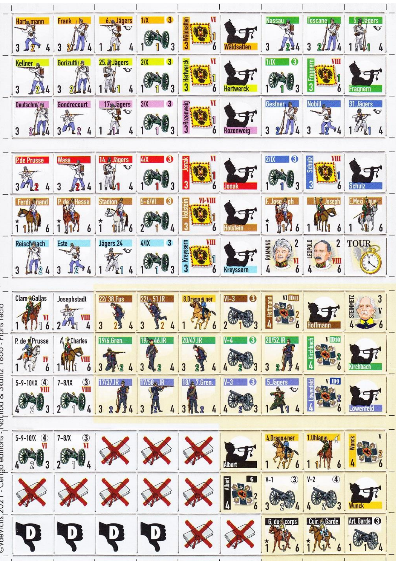
Foto 3 – La fustella con tutte le unità ed i marcatori necessari al gioco.

©YaeVictis 2021 - Cérigo éditions - Nachod & Skalitz 1866 - Pions recto