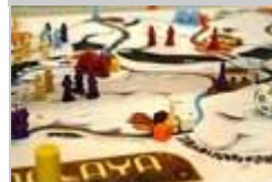
Un momento di una partita.