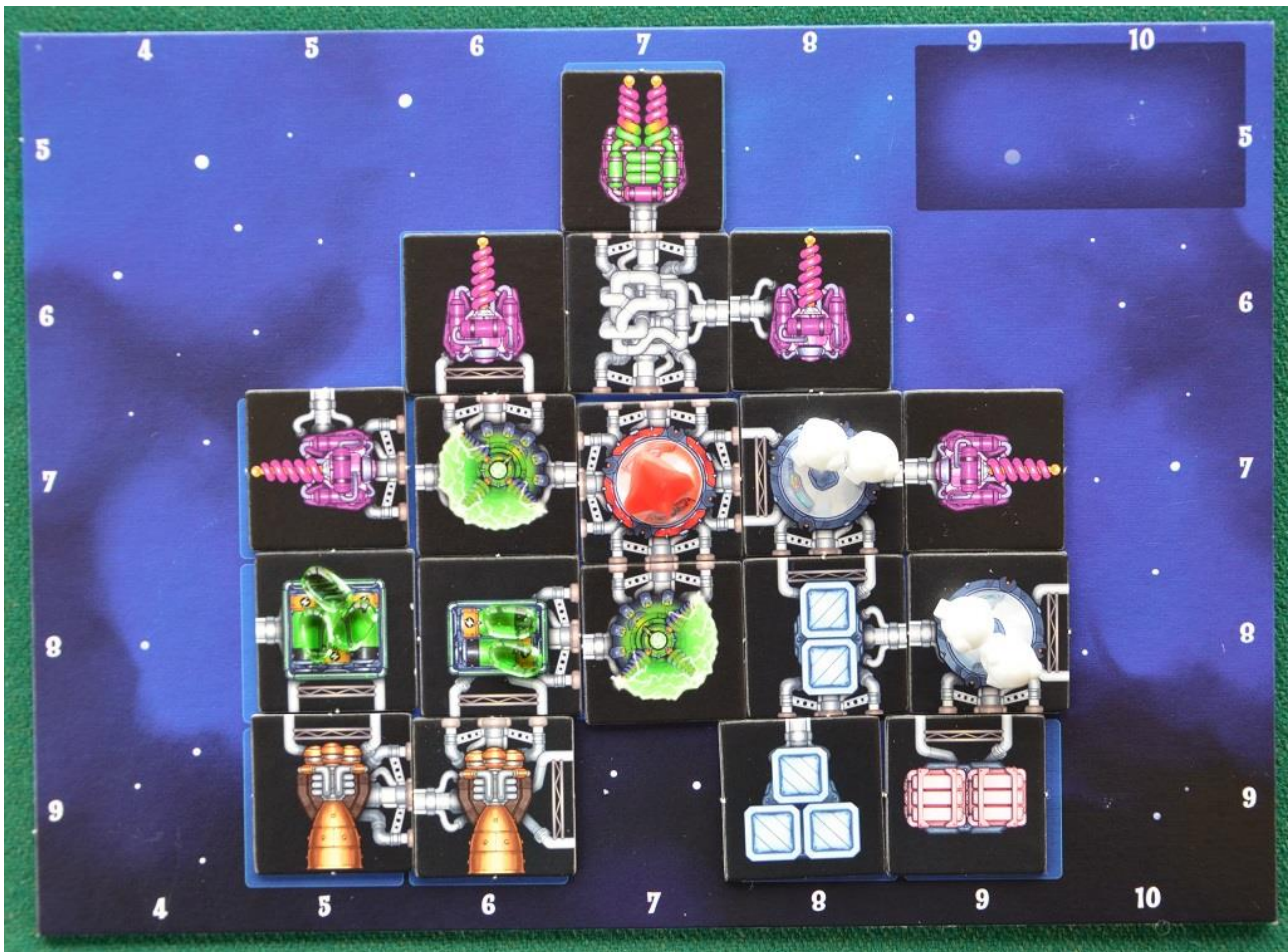
Foto 4 – Esempio di astronave di Livello I costruita dal giocatore “rosso”.