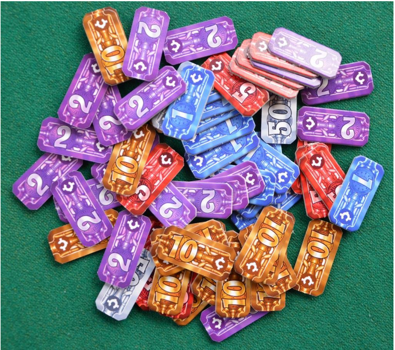
Foto 10 – I Crediti Stellari sono rappresentate da tessere colorate.

Avere 4-6 astronauti a bordo nelle missioni facili serve per abbordare, per esempio, le stazioni abbandonate ed incamerare i cubetti che esse trasportano: se il numero di astronauti disponibili non è uguale o superiore a quello richiesto dalla carta bisogna rinunciare e il turno passa al giocatore successivo: vi consigliamo quindi di guardare tutte le carte “Avventura” prima di iniziare la costruzione dell’Astronave, in modo da equipaggiarvi al meglio.