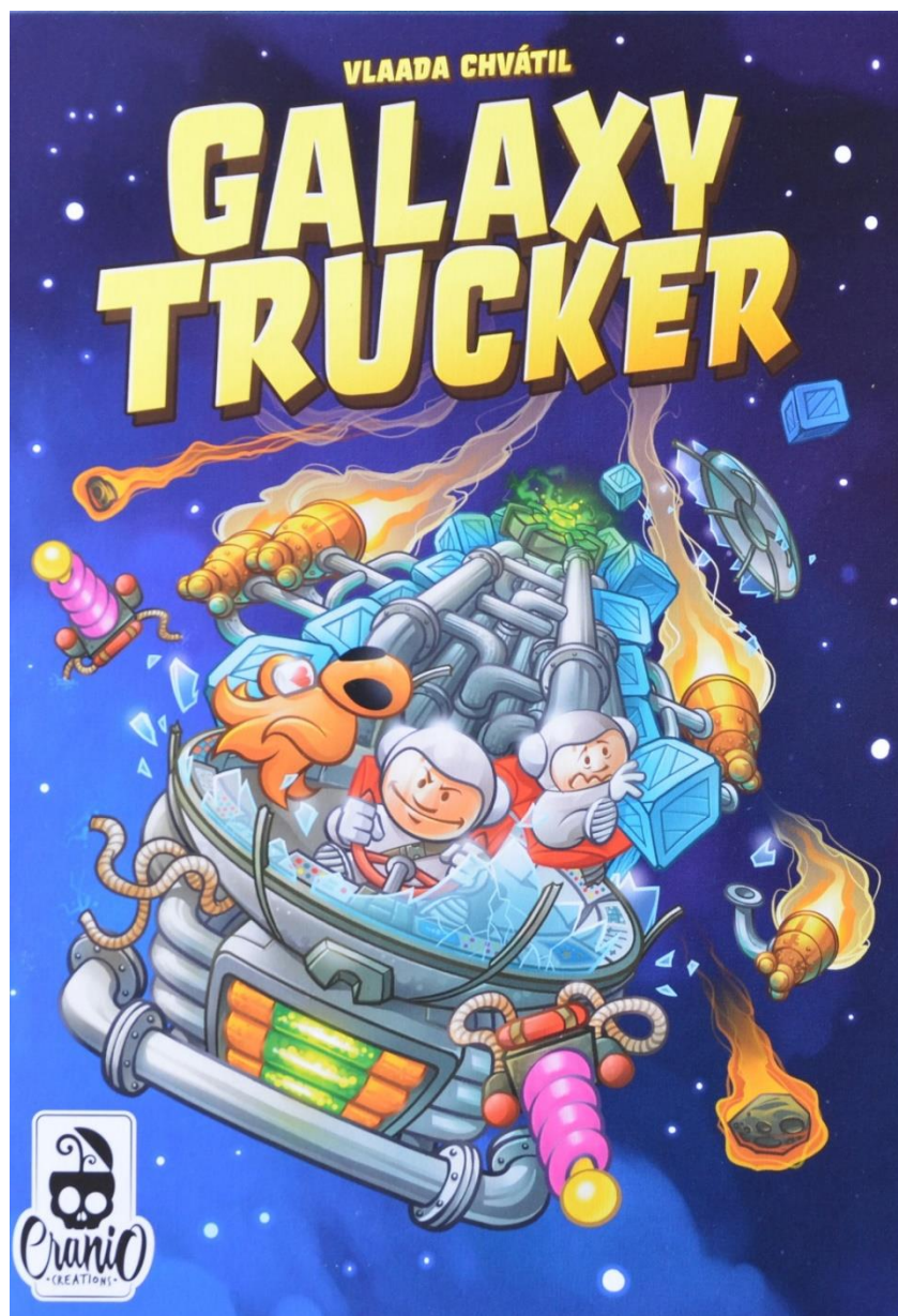
Foto 11 – La scatola di Galaxy Trucker, seconda edizione.[/caption]

Infine due parole sulla posizione da occupare nel tracciato della Plancia Volo: essere i primi significa poter effettuare un abbordaggio (stazioni spaziali o astronavi abbandonate) senza... concorrenza, incamerando preziosi cubetti, oppure scegliere per primi su quale pianeta atterrare, tuttavia il primo della flotta è anche colui che, in caso di attacco da parte dei Contrabbandieri, subisce il primo attacco: se riesce a respingerlo la minaccia finisce lì, altrimenti il nemico attaccherà la seconda astronave, ecc.