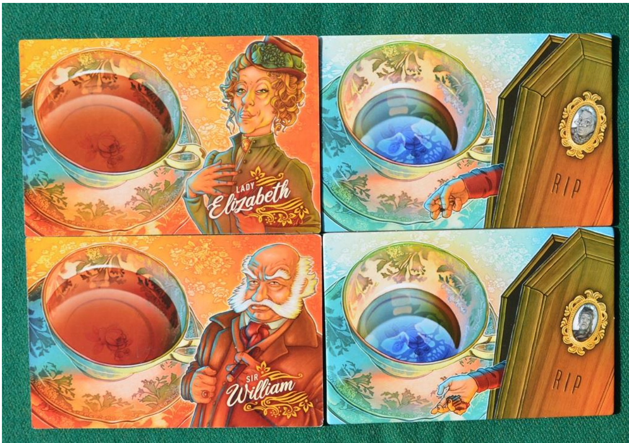
Foto 7 – Le plance dei giocatori: a sinistra la tazza di tè dove riporre i biscotti presi e a destra il personaggio scelto: tutti con un ghigno sinistro.

Naturalmente il capo gioco deve assicurarsi che i biscotti vengano mischiati attentamente, ma a volte seguire con gli occhi quello scartato (soprattutto da metà partita in poi) vi potrebbe far capire dove sia finito (per lo meno approssimativamente) e vi consiglierà di prenderne quindi un altro dello stesso tipo, con la fondata speranza di trovarne uno vuoto o con una sola bottiglietta.