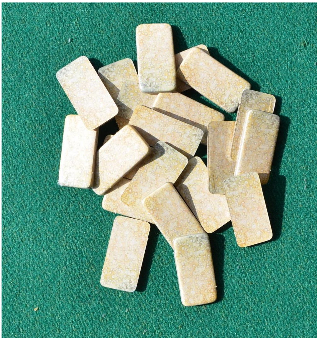
Foto 6 – Le zollette di zucchero, contrariamente ai biscotti, non sono molto realistiche, ma il loro utilizzo è davvero importante.

Le zollette di zucchero ricevute ad inizio partita sono molto importanti, ma devono essere usate nel migliore dei modi: se pescate degli scones con una sola boccetta di veleno è quasi inutile scartarli con lo zucchero, a meno che quella “dose” non vi faccia passare a miglior vita. L’ideale sarebbe arrivare alle ultime fasi della partita con un paio di zollette, sperando che gli avversari siano invece rimasti a zero: in questo modo avrete un paio di giri “sicuri” mentre gli altri, uno dopo l’altro, pescheranno gli ultimi biscotti, solitamente pieni di veleno, e verranno trasportati alla “morgue”. Quasi tutte le nostre partite si sono concluse con un paio di giocatori a contendersi l’eredità e solitamente ha vinto chi dei due aveva conservato più zucchero.