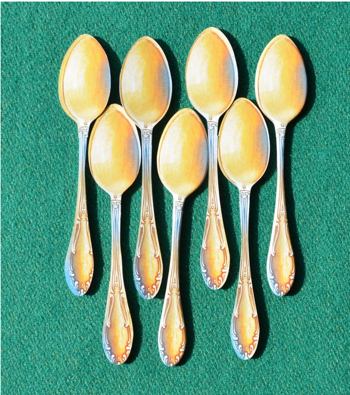
Foto 4 – I cucchiaini che obbligano un avversario a scartare il biscotto appena pescato, nel bene e nel male.[/caption]

biscotto sulla sua plancia e all'altro estremo chi farà un profondo sospiro, mostrando grande indecisione e mimando più volte l'atto di rimettere il pezzo pescato nella scatola per poi, finalmente, decidere di tenerlo.