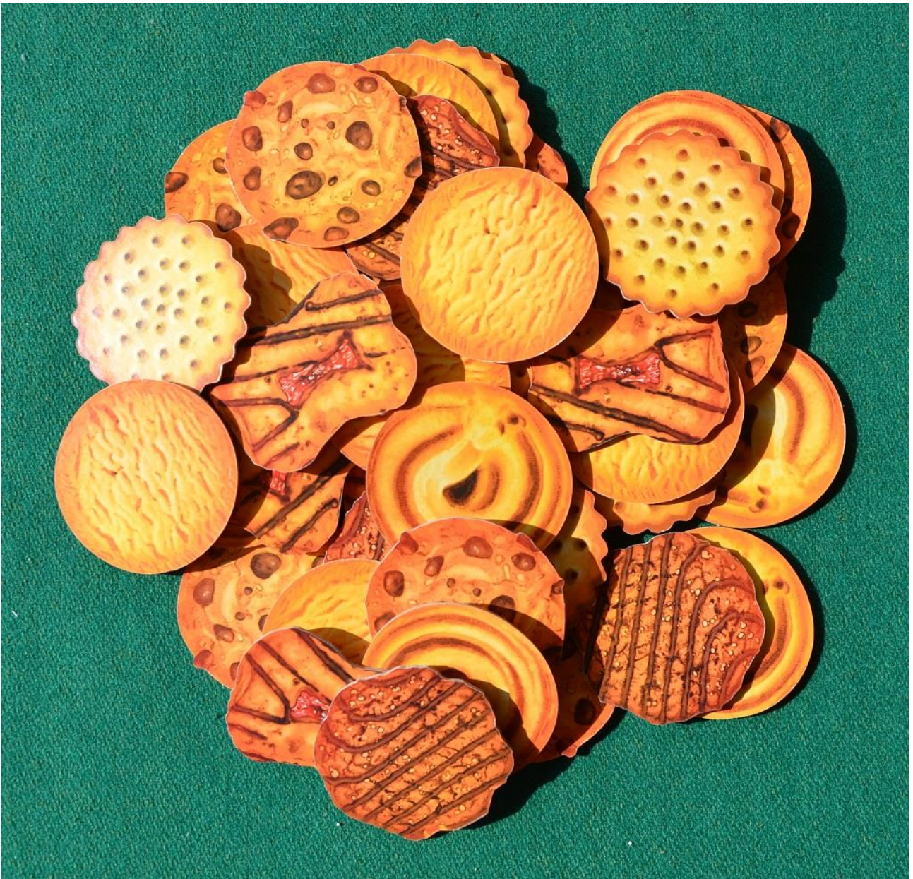
Foto 2 – Una vista dall’alto di tutti gli “scones”: invitanti vero? Peccato che...

Ma stanno suonando alla porta: i nostri invitati sono in arrivo (ma quanti riusciranno ad andarsene “vivi” dopo la partita?) e dobbiamo quindi lasciarvi per andare a riceverli come si deve