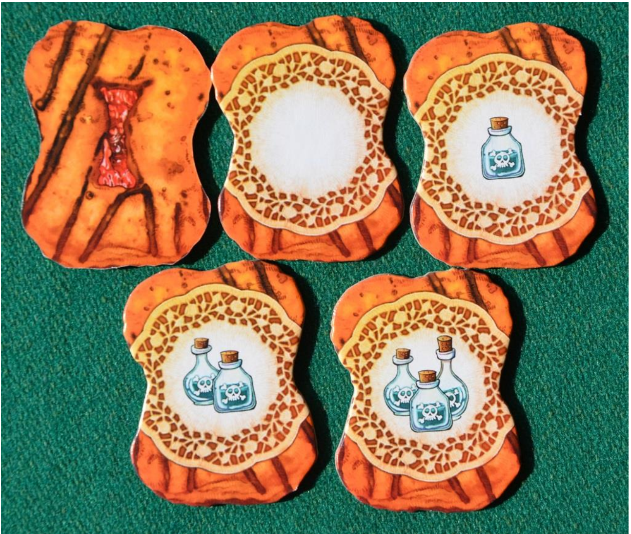
Foto 3 – Esempio di Scones visti da sopra (in alto a sinistra) e sul retro.

voi e gli altri partecipanti dovete calarvi nei panni degli eredi di uno straricco Zio d'America morto da poco tempo: nessuno è disposto a dividere con gli altri l'enorme capitale lasciato dal defunto, per cui siete tutti venuti alla riunione di famiglia armati di un candido sorriso di circostanza e di svariati flaconi di arsenico con cui tenterete di far fuori la "concorrenza".