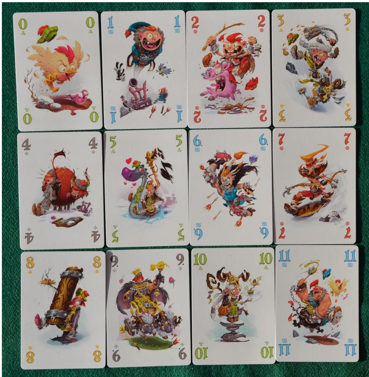
Foto 4 – Un esempio di carte Assedio: ce ne sono dodici per ognuno dei cinque colori, numerate da “0” a “11”.