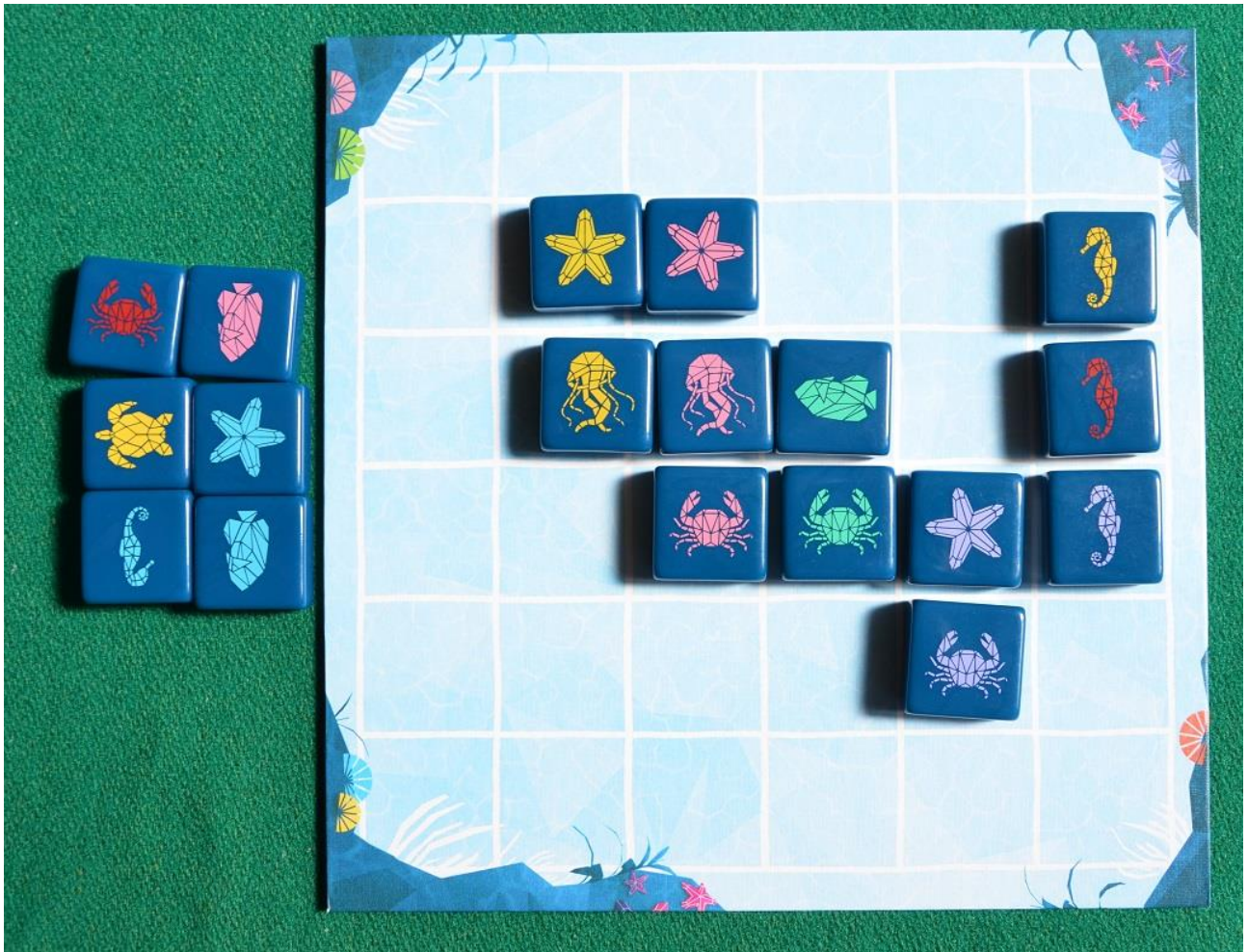
Foto 4 – Ecco come si presenta il tabellone dopo la mossa del giocatore “A”.

Avrete sicuramente notato che la situazione è cambiata molto ed il giocatore “A” in questo momento ha ottenuto una coppia gialla, una verde e due tris (rosa e viola) invertendo completamente la situazione. Il giocatore “B”, vedendo nella riserva il neo arrivato granchio rosso, decide di spostare di nuovo quello viola verso sinistra e di aggiungere il rosso immediatamente alla sua destra. Potete vedere la situazione attuale nella foto 5 qui sotto, che mostra come il giocatore “B” non solo ha spezzato il tris viola dell’avversario, ma ha ora quattro tessere uguali adiacenti (una combinazione già abbastanza forte).