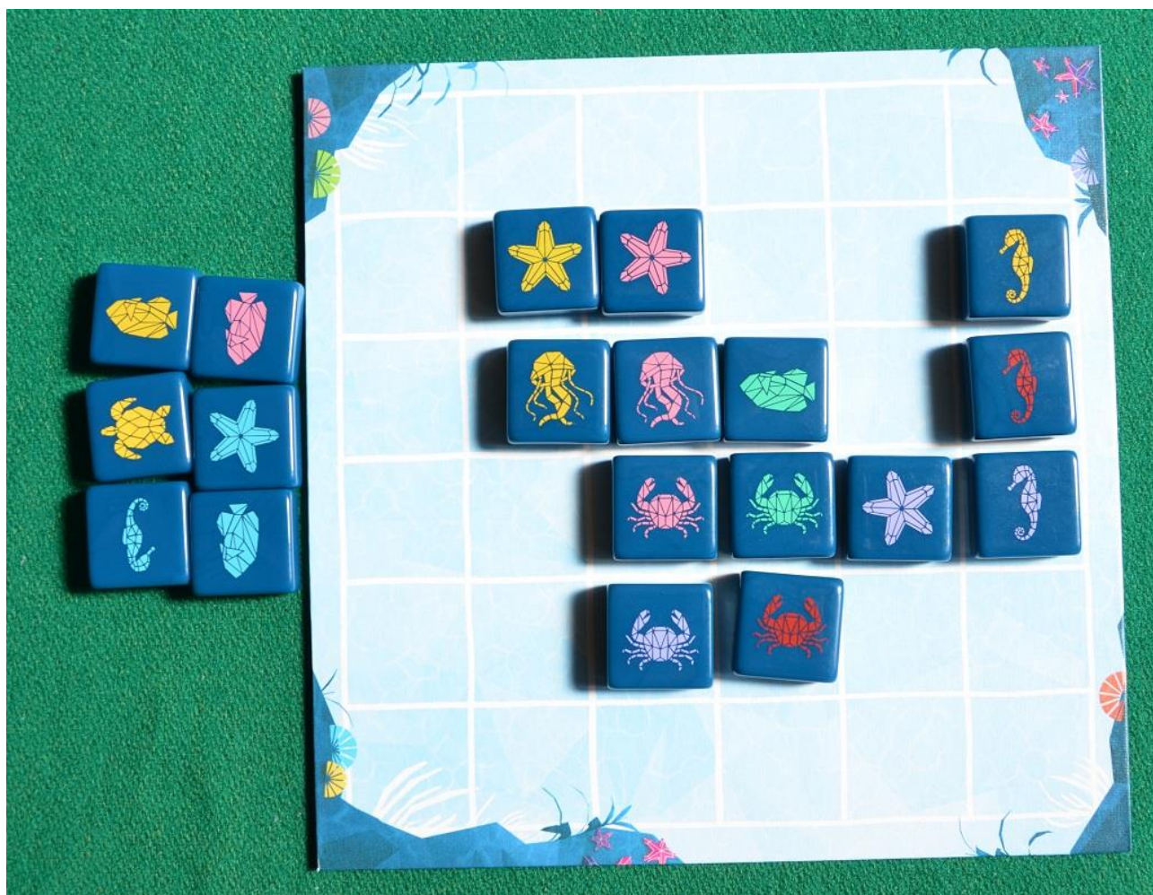
Foto 5 – Dopo la mossa del giocatore “B” la situazione è aggiornata come si vede.

Le partite ad Aqualin procedono in questo modo fino al riempimento totale della griglia: si procede allora con il conteggio dei Punti Vittoria (PV), i quali sono assegnati nel modo seguente: - 1 PV per ogni gruppo di due tessere (stesso colore o stessa creatura); - 3 PV per ogni gruppo di tre tessere; - 6 PV per ogni gruppo di quattro tessere; - 10 PV per ogni gruppo di cinque tessere; - 15 PV per ogni gruppo di sei tessere. Vediamo se riuscite a calcolare i punti dei due giocatori guardando la foto che segue, scattata alla fine di una partita.