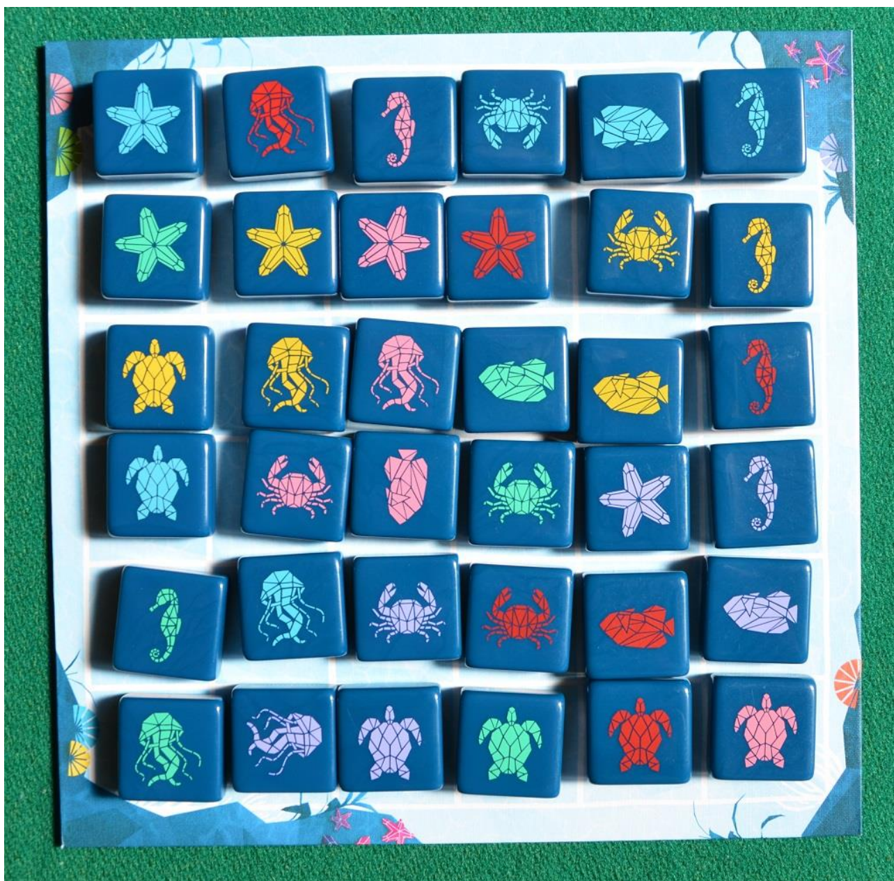
Foto 6 – Il tabellone completamente riempito dopo una partita piuttosto tirata.

Vi suggeriamo di procedere contando prima i gruppi colorati e poi quelli con le stesse creature. Essendo infinitamente buoni vi diamo il risultato finale (31 a 26): ma chi ha vinto secondo voi? La cosa più interessante del gioco è che chi... perde chiede subito una rivincita: è matematico, credeteci, quindi state attenti perché Aqualin può dare “dipendenza”... Tuttavia se il vostro avversario perde troppo spesso dategli almeno una possibilità di vittoria ogni tanto perché le tessere tirate in faccia con rabbia sono piuttosto dure!