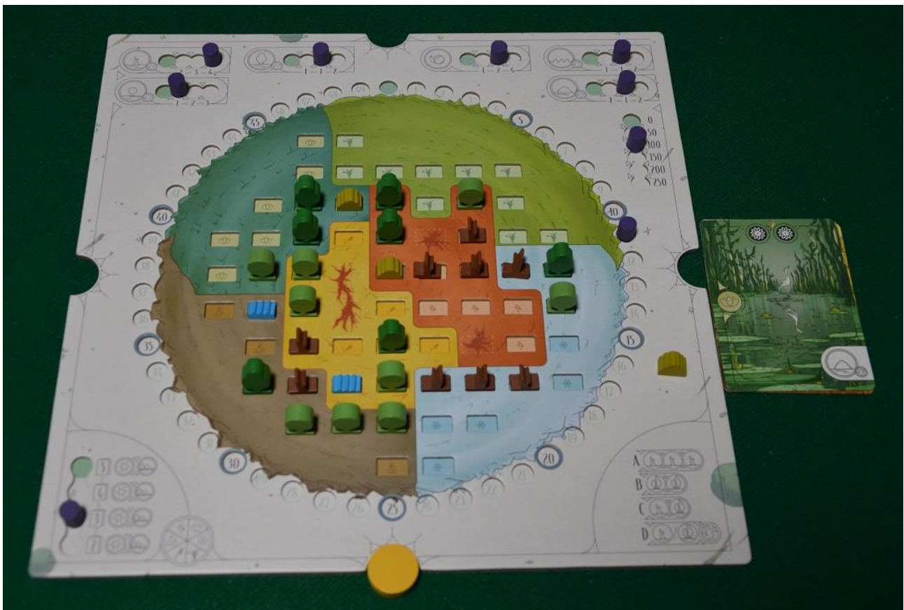
Foto 7 – La plancia "Pianeta" di un giocatore durante il terzo round di gioco.

I germogli ovviamente non fanno ombra, e neppure i cespugli ed i laghi, ma ogni albero "piccolo" mette in ombra la casella dietro di lui, mentre ogni "grande" ne mette in ombra due: si tratta, come vedete, di un meccanismo molto simile a quello di Photosynthesis.