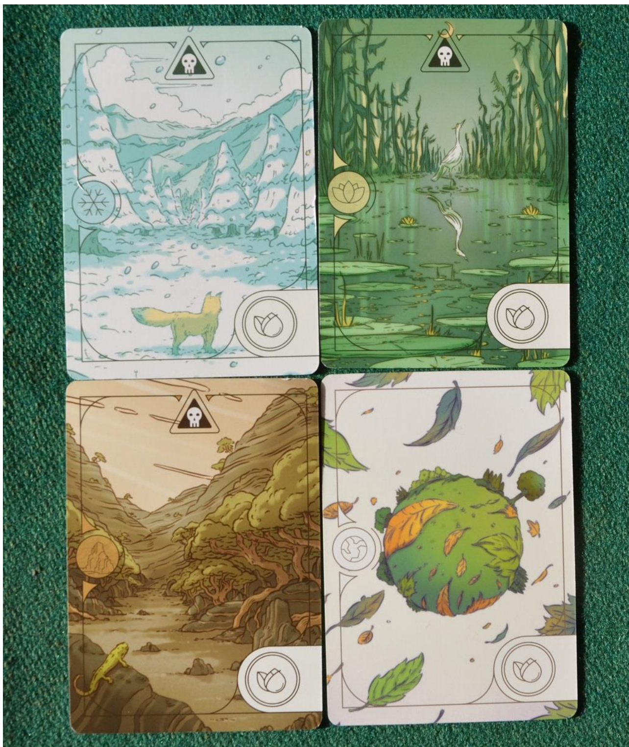
Foto 10 – Gli altri tre tipi di carte “Bioma” e il Jolly (in basso a destra).

Dalla descrizione appena letta avrete capito l'importanza dei “moltiplicatori di Fertilità” alla fine di ogni partita di Evergreen , quindi il primo suggerimento è quello di tenere sempre un occhio ben aperto sul numero totale di “fiori” che si stanno accumulando nei vari biomi e di cercare di acquisire il maggior numero di carte di quel tipo per poter far crescere degli alberi grandi nelle zone più “ricche”.