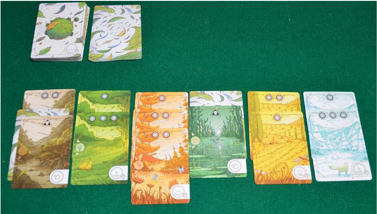
Foto 8 – Le carte "Fertilità" che si sono accumulate alla fine di una partita.

Il primo round/stagione è composto, come abbiamo già anticipato, da 5 turni (quindi i giocatori possono scegliere fino a 5 diverse carte in cinque mani successive); il secondo sarà di 4 turni, il terzo di 3 e l'ultimo di 2 soli turni. Al termine del quarto round la partita finisce e, dopo avere eseguito i soliti calcoli per la luce del sole e la grandezza delle foreste, si passa alla valutazione dei "biomi", moltiplicando il numero di alberi "grandi" di ogni zona sul pianeta per il loro valore di fertilità.