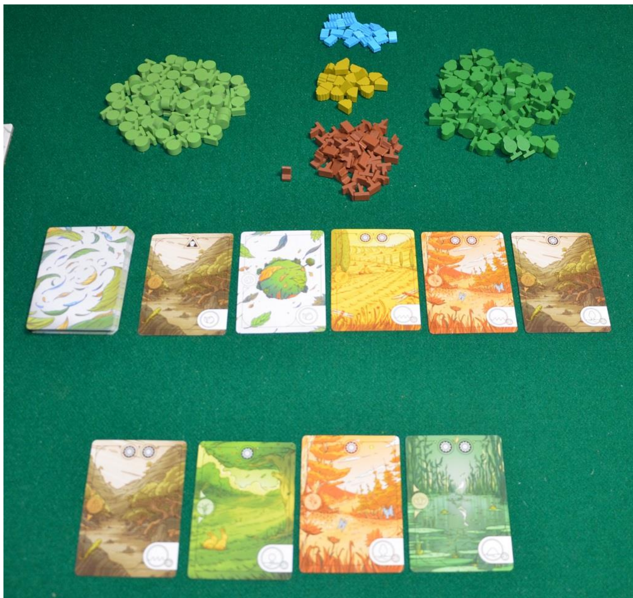
Foto 5 – Ecco come appare il centro del tavolo all’inizio di una partita a quattro: in basso si vedono le carte “Fertili” estratte a caso prima di mescolare il mazzo.

Il primo giocatore prende una delle carte scoperte accanto al mazzo e posa il segnalino “Primo Giocatore” sulla carta più a sinistra fra quelle rimaste in tavola, poi decide quale tipo di azione effettuare, scegliendola fra le quattro possibili (che sono indicate anche sulla parte destra, in basso, della plancia):