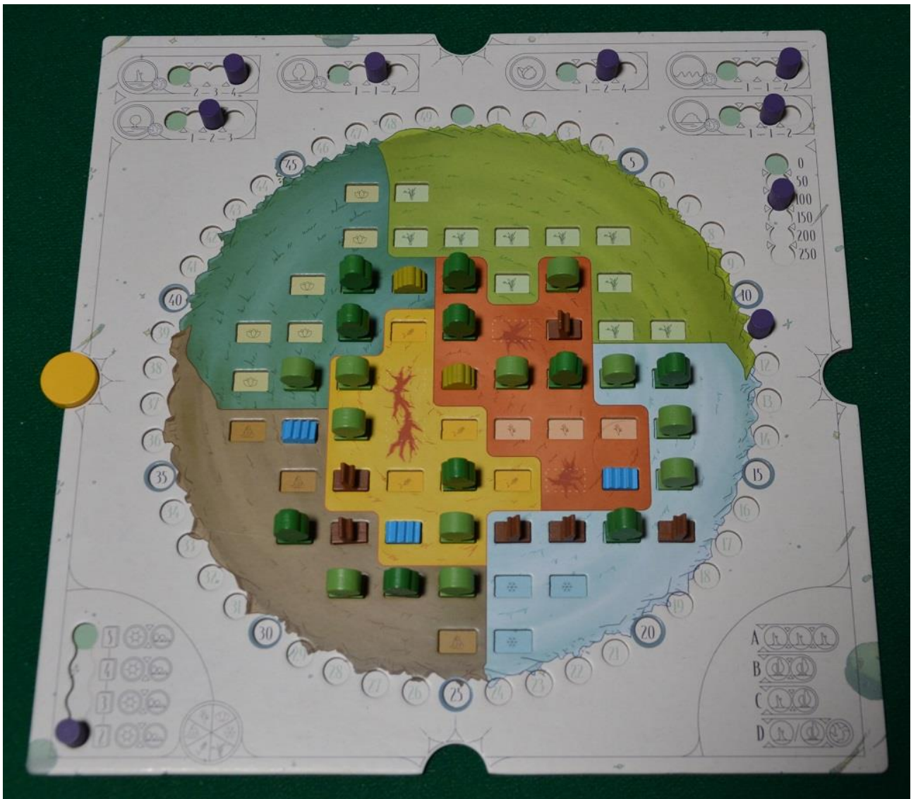
Foto 9 - Esempio di plancia completata a fine partita.