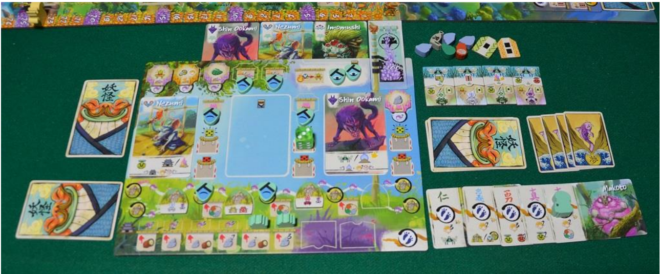
Foto 11 – La postazione di un giocatore nelle ultime fasi della partita.

La partita a Bitoku finisce quando il “Grande Spirito” raggiunge l’ultima casella del suo percorso e... ascende! I giocatori invece restano con i piedi per terra ma devono conteggiare il loro punteggio tenendo conto di: eventuali PV garantiti dai cristalli sulle loro plance; numero di carte Bitoku di colore diverso che sono state collezionate; posizione dei Kodama nei quattro laghi; numero di rocce Iwakura adorare dai Pellegrini; numero di carte “Vision” soddisfatte; punteggio dei dadi. Il giocatore che è Primo nel Turno a fine partita riceve inoltre 3 PV extra.