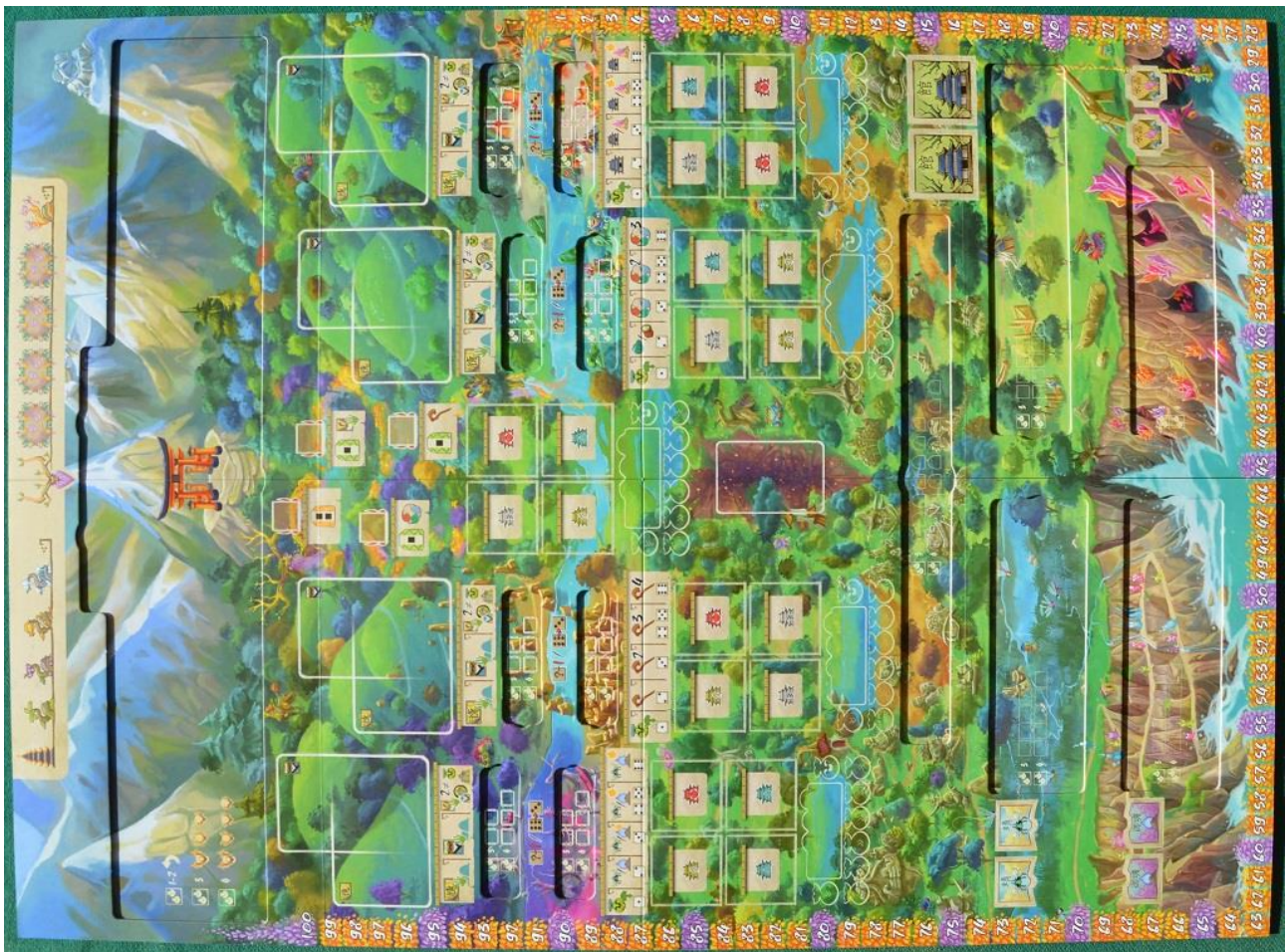
Foto 2 – Il tabellone sul Lato A: notare le “finestre” per l’inserimento degli inserti.

Nella nostra copia del gioco erano inclusi due libretti per le regole (in inglese e in spagnolo) insieme a 8 pieghevoli di cartoncino (4 in inglese e 4 in spagnolo) con il sommario dei turni, le condizioni di vittoria e la spiegazione per le decine di icone utilizzate.