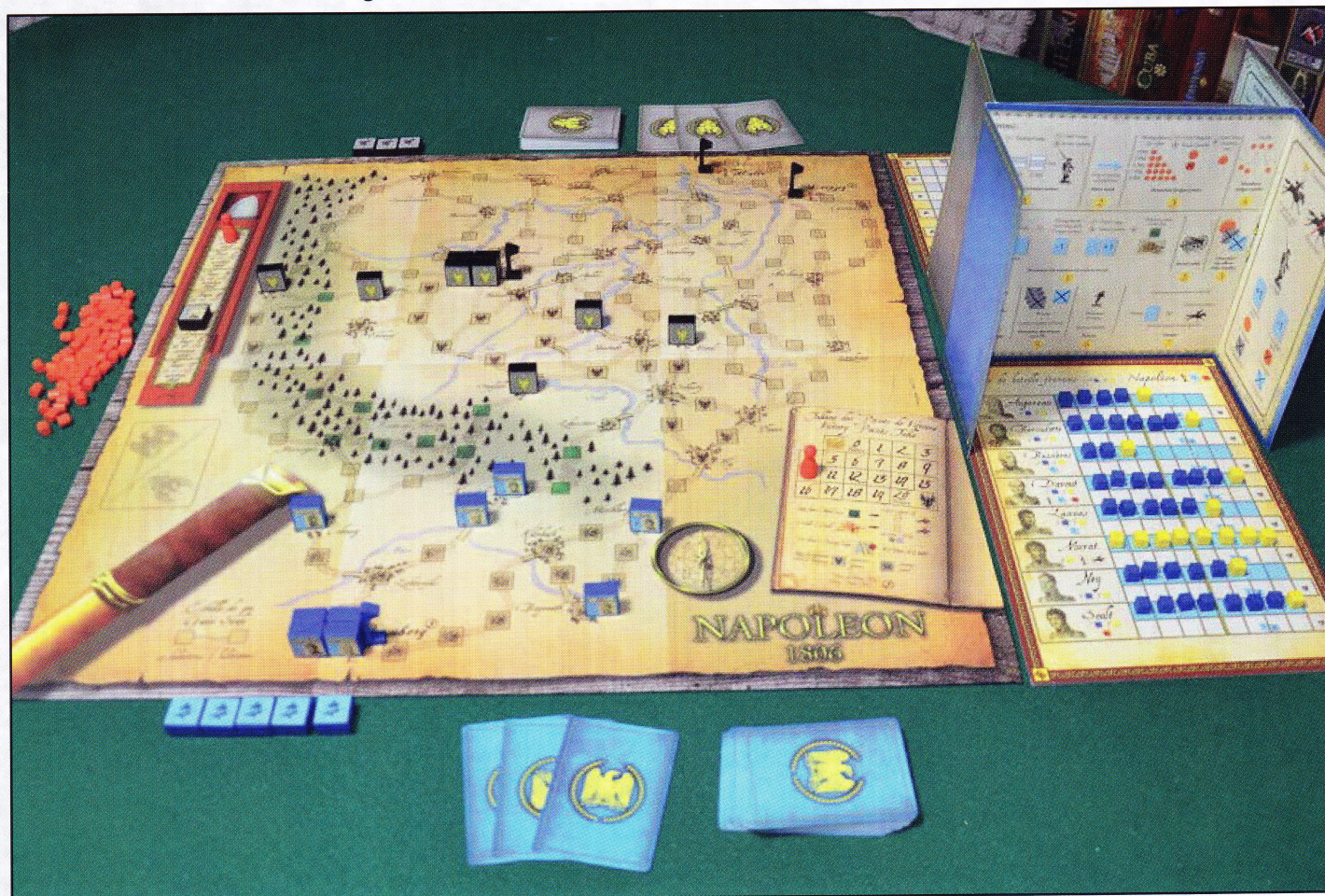
Foto 6 - Tavolo pronto per una partita a Napoleon 1806 con le regole avanzate

Se alla fine del movimento è stato generato un combattimento (cioè se ci sono unità dei due schieramenti nella stessa località) esso deve essere risolto subito; altrimenti il turno passa all'avversario che, a sua volta, sceglie un'unità o una pila, cerca di muoverla, e così di seguito. Ogni unità mossa (o che ha combattuto) viene capovolta per indicare che è già stata attivata e non può più essere