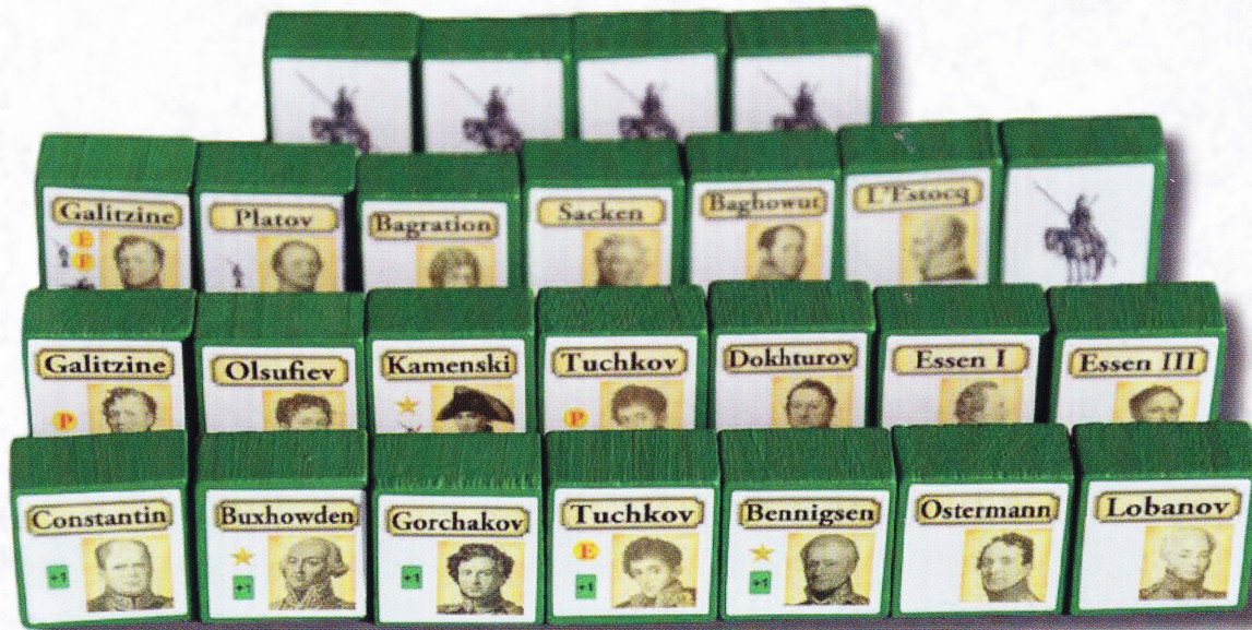
Foto 4 - Le unità Russe in 1807

(generale) ed il retro (bandiera) abbiano lo stesso verso. I Comandanti in capo sono riconoscibili da una stellina (Buxhowden, Bennigsen e Kamenski nella foto) mentre delle piccole icone mostrano caratteristiche personali di quella unità: per esempio una piccola carta di colore verde (come quelle stampate su Constantin) significa che quel generale avrà una carta extra in combattimento; un piccolo fante significa che quell'unità potrà muovere di un passo extra; un cavallo darà un vantaggio negli inseguimenti, ecc. Le lettere rosse in un cerchietto giallo (come quella di Tuchkov) indicano semplicemente in quale scenario sarà schierata quella unità: alcuni generali infatti sono presenti più volte con piccole differenze, ma ovviamente solo uno di essi verrà utilizzato nei singoli scenari.