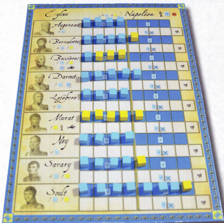
Foto 5 - OOB Francese in 1807

Prima della partita i due avversari devono accordarsi sul "grado di difficoltà" da utilizzare nel gioco: base o avanzato. Nel primo caso le unità saranno schierate in campo con la faccia visibile verso l'alto e le plance OOB saranno visibili ad entrambi. Nel secondo (le regole dette dei "grognard")