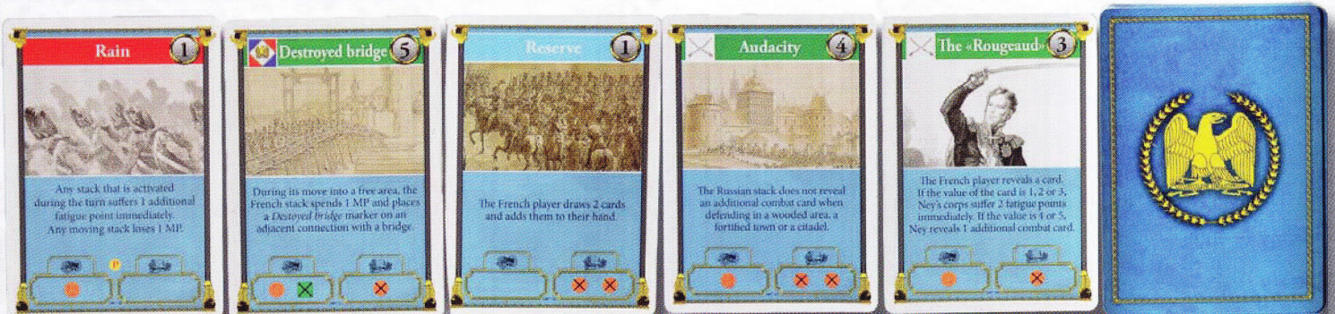
Foto 3 - Alcune carte del mazzo francese di 1807

escono due o più carte rosse (non importa chi le ha pescate) esse si annullano a vicenda e vengono scartate. Le carte con banda "azzurra" (come la terza da sinistra nella Foto 3 più sotto) indicano degli eventi che possono essere attivati solo durante la fase di iniziativa (come vedremo più avanti). Le carte con banda "verde" sono decisamente le più numerose: un simbolo a sinistra della banda indica "quando" possono essere giocate: se appare una bandiera francese si applicano nel turno del francese (movimenti extra, carte combattimento extra, Rinforzi, ecc.); con la bandiera dei coalizzati si usano quando gioca l'avversario (solitamente per penalizzarlo rallentandolo o bloccando il suo turno, ecc.); se ci sono due spade incrociate significa che potrà essere giocata in combattimento; ecc. Sull'angolo in alto a destra di ogni carta c'è un numero che varia solitamente fra 1 e 6 (ma ogni volume della serie ha le sue caratteristiche ed i suoi limiti) e servirà, come vedremo fra poco, per regolare il movimento delle unità.