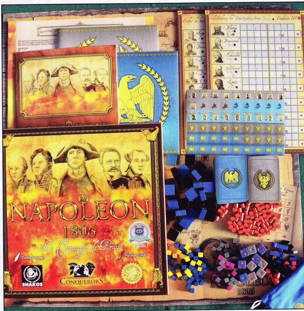
Foto 8 - I componenti di Napoléon 1806

di cui sopra: alla fine ogni giocatore pesca il numero di carte cui ha diritto e le scopre sul tavolo. Ogni quadratino barrato nella casella di sinistra indica una perdita per l'avversario a cui si aggiunge la fatica (un punto per ogni pallino arancione). I giocatori devono immediatamente assegnare le perdite e la fatica distribuendole equamente fra le unità ingaggiate.