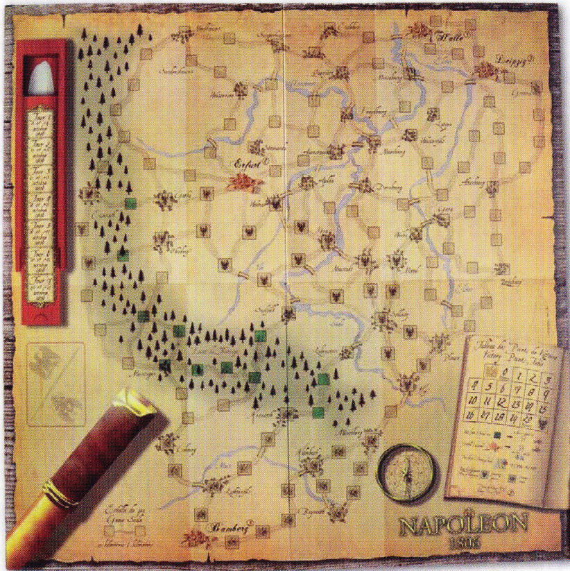
Foto 2 - La mappa di 1806

Ogni esercito ha a sua disposizione un mazzo di carte personalizzato con tre tipi diversi, come potete vedere dalla foto qui sotto. Le carte con banda "rossa" indicano avvenimenti che influiscono su uno o entrambi gli eserciti (pioggia, fango, neve, ecc.) e devono essere obbligatoriamente giocate quando pescate nella fase iniziale di ogni turno. Il loro "evento" avviene immediatamente e dura per tutto il turno, a volte influenzando anche quello successivo: per esempio in 1807 se piove in un turno nel successivo, automaticamente, abbiamo il fango nelle strade. Fortunatamente se