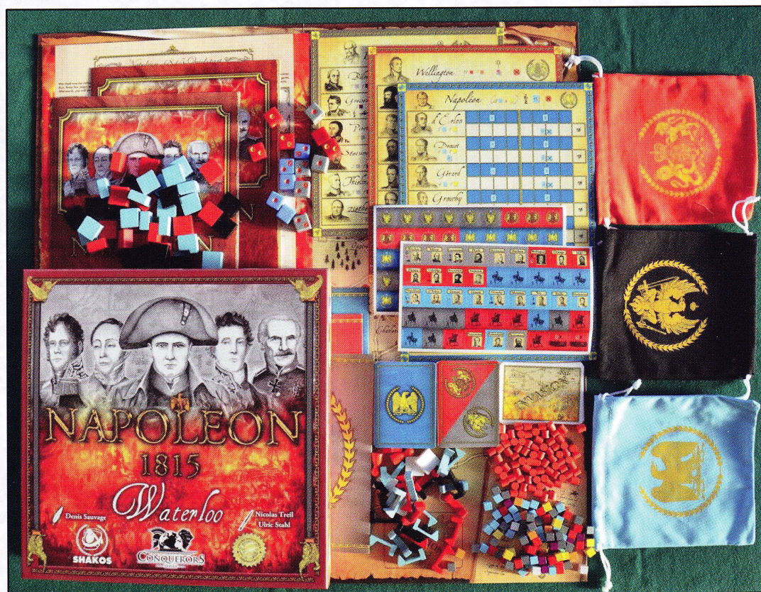
Foto 10 - I componenti di Napoléon 1815