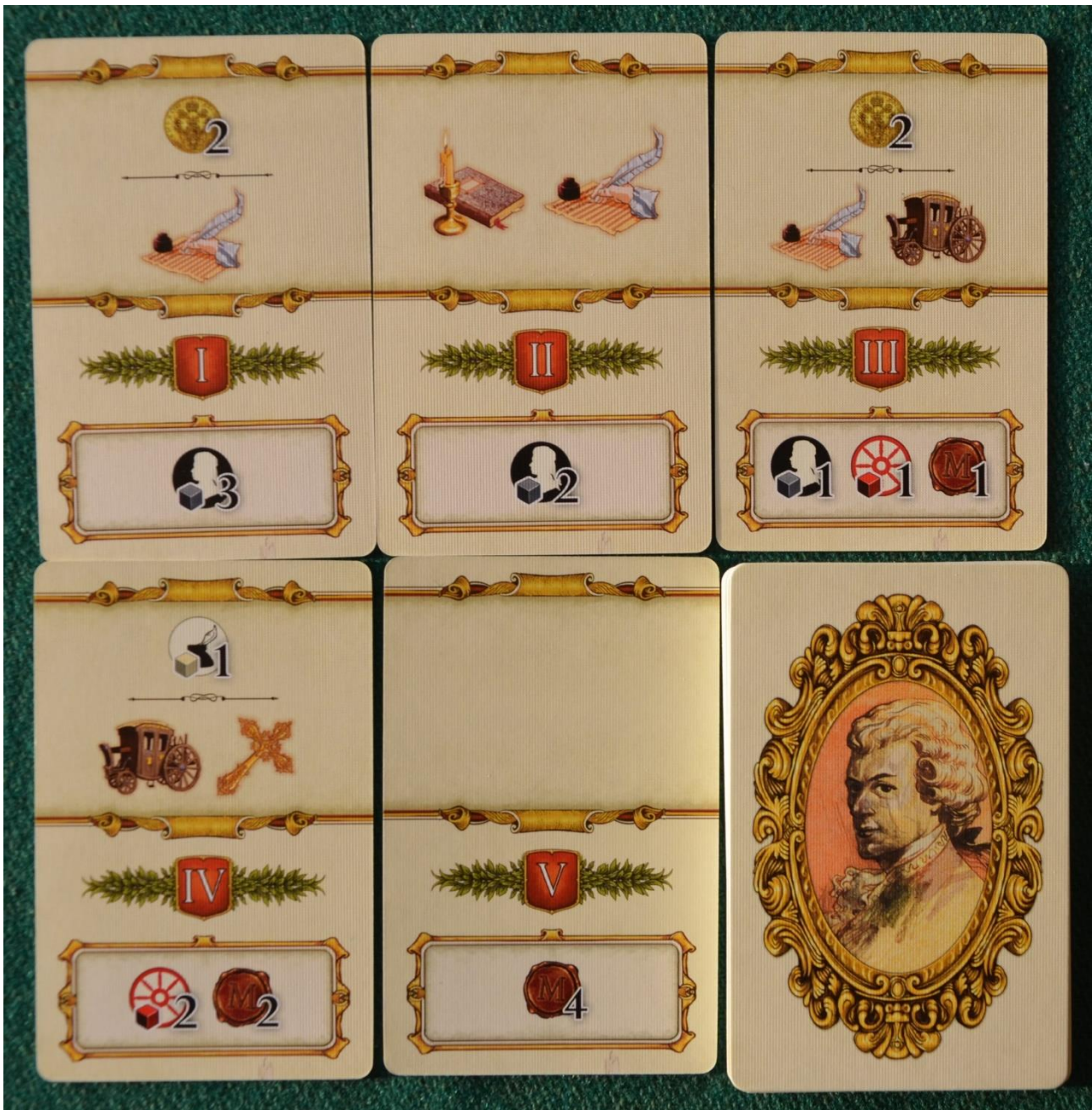
Foto 6 – Alcune carte Ricordo delle diverse Epoche: notare come aumentino i bonus e i vantaggi delle azioni più si avanza col tempo.