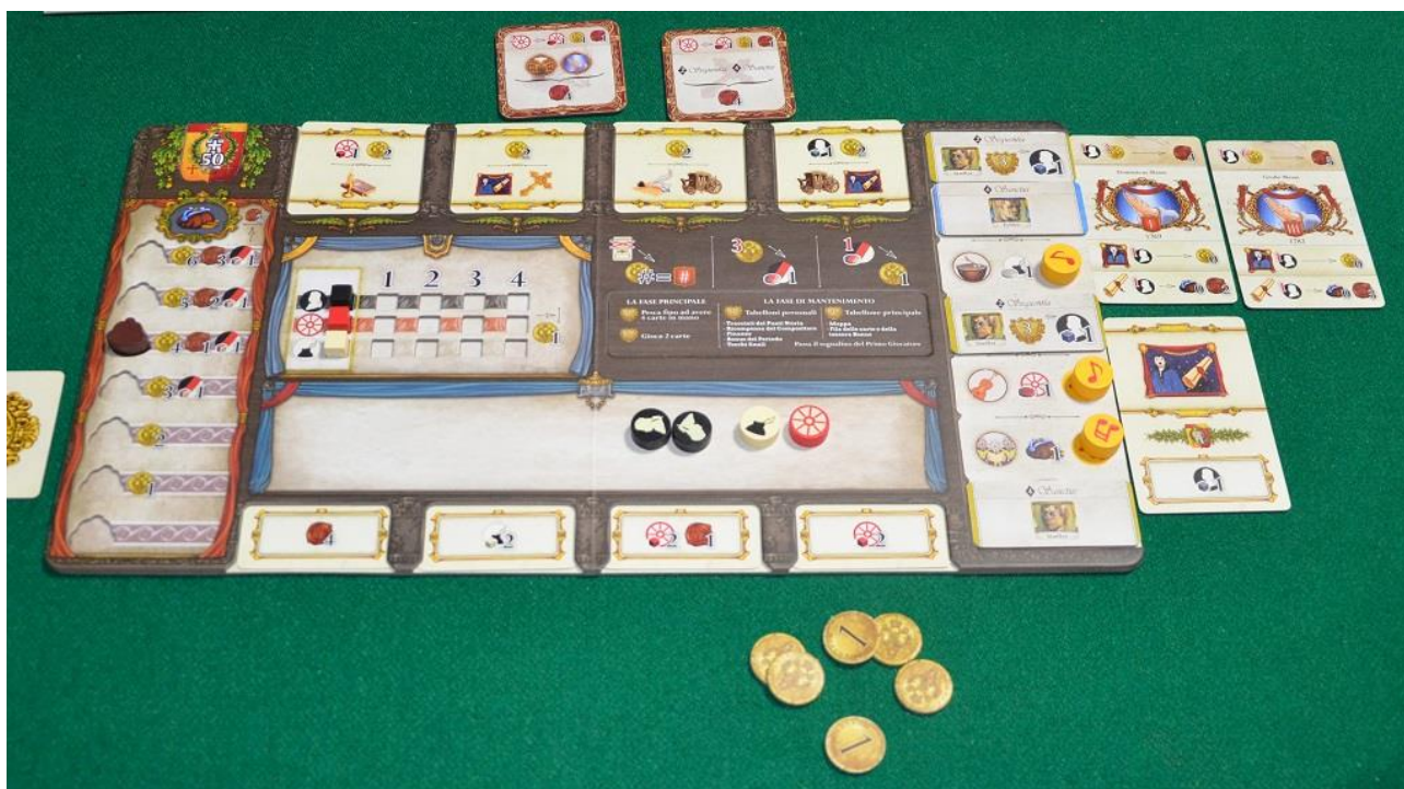
Foto 7 – Ecco come si presenta la plancia di un giocatore al termine del round: notate che ha tre opere pronte, due tessere Corte Reale, 6 dobloni e gli sono rimasti solo tre cilindretti "Nota", ma ha accumulato qualche dischetto "Risorsa" al centro della sua plancia.

Il round (Epoca) termina quando tutti hanno eseguito quattro azioni (cioè quando i giocatori hanno riempito gli otto slot della loro plancia).