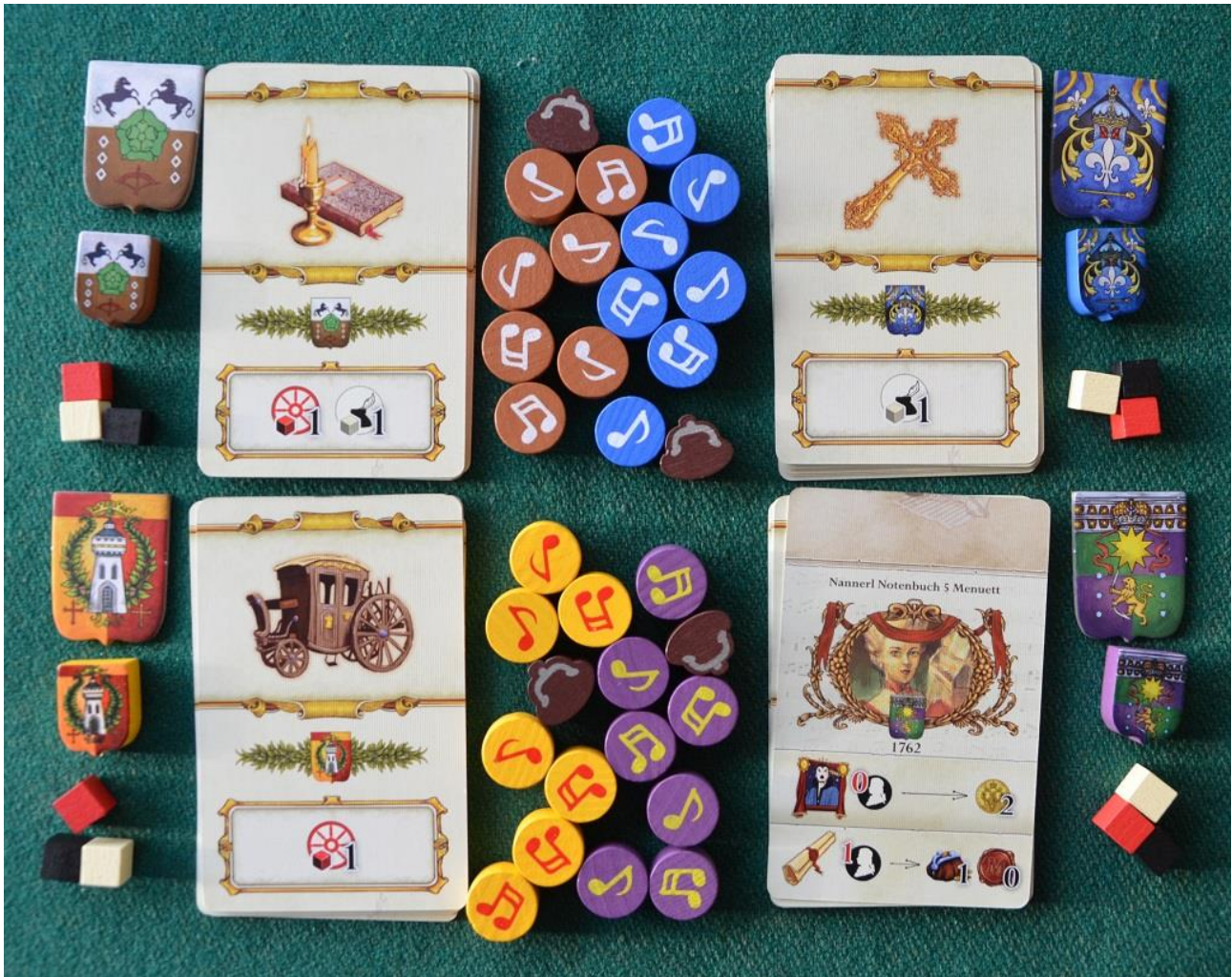
Foto 2 – La dotazione iniziale dei giocatori: notate in particolare i cilindretti di legno, colorati e serigrafati con “crome” e “biscrome”.

I materiali di Lacrimosa sono tutti di buona qualità e graficamente ben fatti: i segnalini di legno sono in gran parte serigrafati; le illustrazioni sulle carte sembrano piccoli “quadri” che illustrano oggetti e teatri dell’epoca; la tessera del primo giocatore ha la forma di un “diapason”; ecc. Tutto aiuta, in definitiva, ad entrare al meglio nell’ambientazione scelta dai due autori iberici.