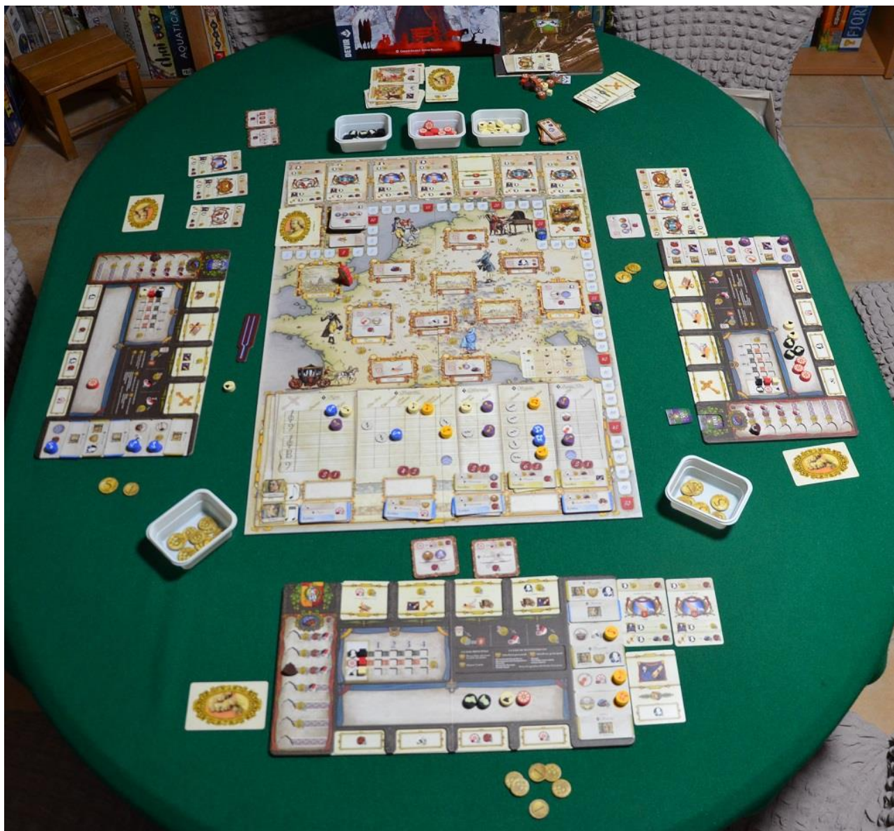
Foto 10 – Ecco come si presenta il tavolo al termine di una partita a tre.

Come in tanti altri giochi di questo livello, anche in Lacrimosa è possibile fare punti in vari modi, ma occorre una strategia di base, cosa che potrete cominciare a decidere solo dopo le primissime partite di prova, necessarie per imparare la meccanica: non è possibile, per lo meno a nostro avviso, fare “tanto” di “tutto” e quindi è necessario darsi qualche priorità, anche se non si possono trascurare del tutto le altre opzioni per aggiungere punti extra al proprio totale