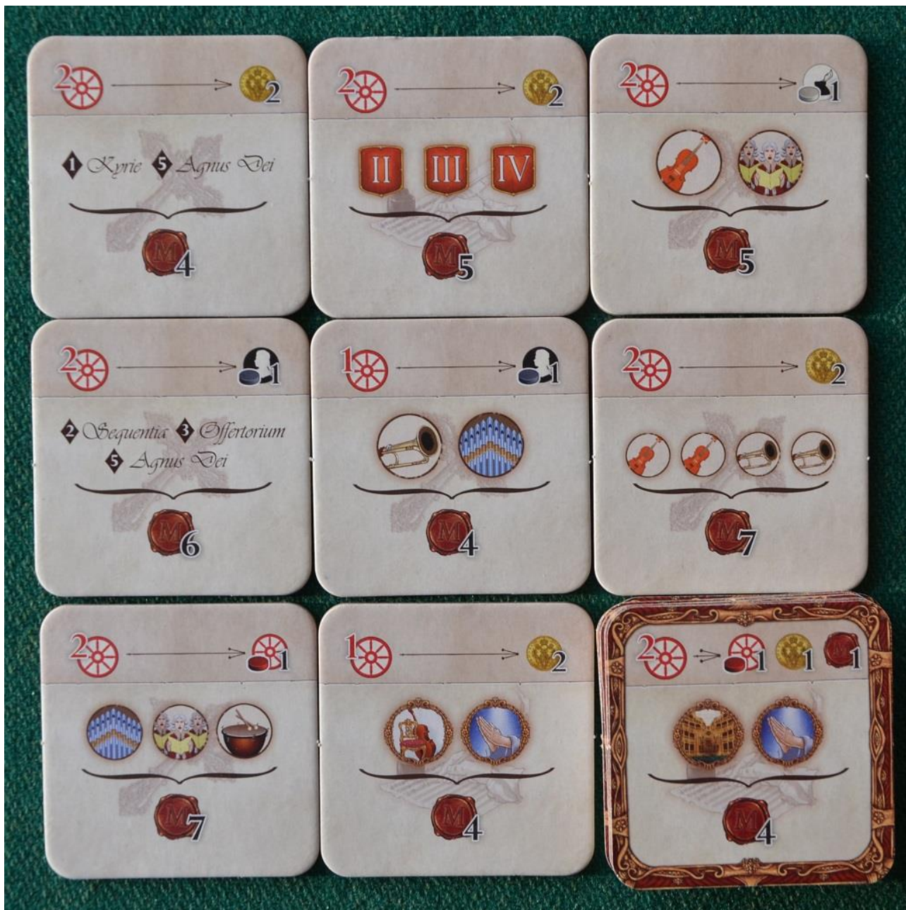
Foto 11 – Le tessere “Corte Reale” fanno guadagnare PV soprattutto collezionando carte Opera.

Spesso questa strategia viene affiancata dalla ricerca di tessere “Compositore” che permettano di rappresentare o vendere più Opere, indipendentemente dalla carta “Azione” utilizzata. Per i compositori servono però le risorse di colore bianco (Storia della Composizione), quindi bisogna procurarsene un po’ (soprattutto con le tessere città della mappa) per tenerle di scorta.