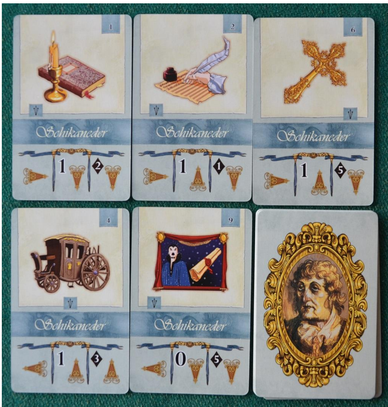
Foto 12 – Le carte “Solista” per il gioco in solitario (ovviamente!).

quanto si incassa nelle diverse destinazioni. Questa è un'opzione poco utilizzata nelle primissime partite, poi ci si rende conto che può essere interessante se il “ricavato” può essere investito nel nostro progetto. Tanto più che spesso le risorse incassate regalano dischetti “Storia” extra che non si devono azzerare a fine round (come succede con i cubetti).