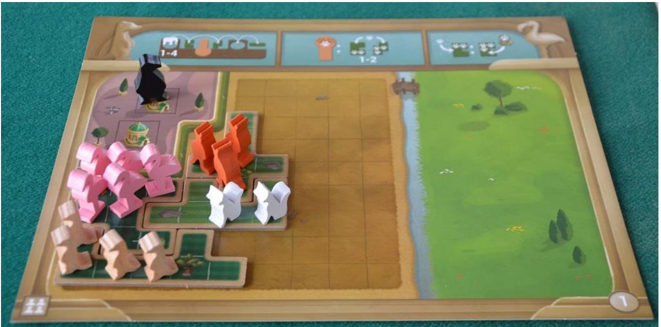
La plancia dei giocatori durante la partita.

In New York Zoo la vera differenza la fanno dunque gli animali: ogni recinto completato permette infatti al giocatore di acquistare una tessera “speciale” (le attrazioni, appunto, fra cui persino un "Otto volante") della forma adatta a chiudere qualche “buco” sulla griglia o a completare più in fretta la griglia.