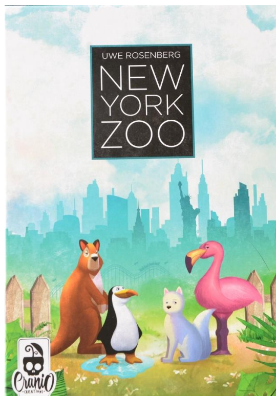
La scatola del gioco.

Stiamo procedendo con le partite di prova insieme a vari gruppi di giocatori e le risposte fino ad ora sono davvero positive, soprattutto in famiglia o con giocatori saltuari: tutti sono particolarmente attratti dalla folla di animaletti che pian piano riempie i nostri recinti. Torneremo quindi con una recensione approfondita fra un paio di settimane.