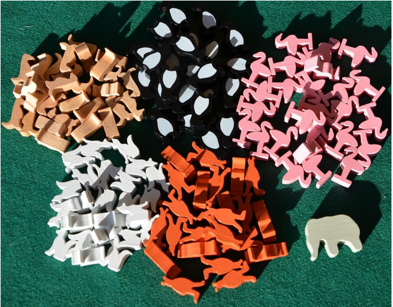
Tutti gli animaletti dello Zoo.

Possono partecipare al gioco da 1 a 5 "impresari" interessati a creare il loro zoo (che sia poi davvero a New York o altrove è assolutamente ininfluente) e disposti a salire a cavallo di un elefante per andare a cercare e costruire i differenti "recinti" necessari ad ospitare, fenicotteri rosa, candide volpi artiche, trotterellanti pinguini, saltellanti canguri ed le vivacissime manguste.