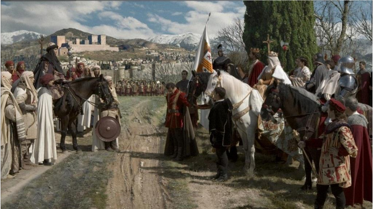
Foto 1 – Isabella di Castiglia e Ferdinando d’Aragona accettano la resa della città di Granada. La “Reconquista” ha finalmente termine.

L’ambientazione è quella della fase finale della “Reconquista”, cioè della lotta di liberazione degli spagnoli contro la dominazione musulmana, cominciata nel 722 e finita il 2 gennaio 1492 con l’ingresso dei Re di Castiglia e Aragona (Isabella e Ferdinando) nella città di Granada, ultimo baluardo del Sultanato dei Nasridi.