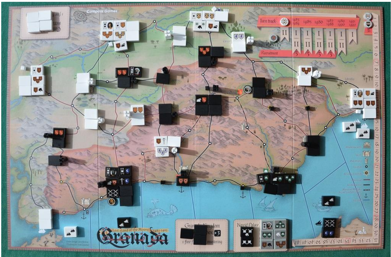
Foto 3 – Le unità sono schierate in campo e si attende solo l’inizio delle ostilità. Notate in alto a destra il tracciato dei turni e, al suo fianco, quello per le battaglie.

Lo schieramento iniziale di tutte le unità, dei castelli e delle torri di guardia è indicato in un’apposita tabella all’interno dei due pieghevoli “Player’s Aid” inclusi nella scatola, sui quali è stampata anche la sequenza di gioco.