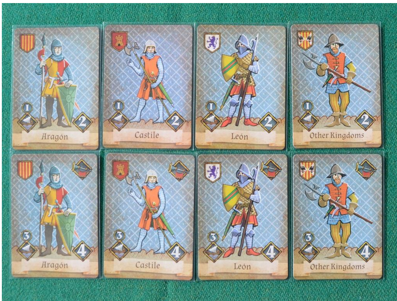
Foto 4 – Le carte delle Unità Cristiane: la fila in alto mostra quelle “standard”, mentre in basso una “trombetta” indica che sono possibili mosse speciali.

Come vedete i disegni ricalcano lo stile degli arazzi e dei dipinti dell’epoca e ogni “regno” all’interno della coalizione ha un suo “stemma” ben preciso, cosa molto importante ai fini del combattimento, come vedremo fra poco.