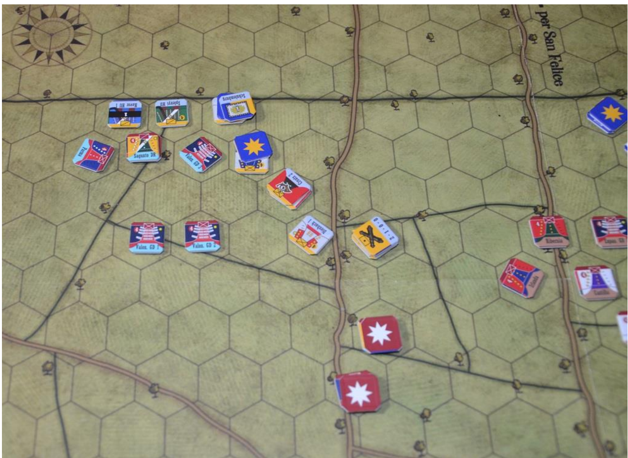
Foto 10 – Una fase della battaglia: i due “asterischi” rossi e il “blu” indicano che quelle unità hanno subito un HIT nel corso del turno.

L’unità sconfitta va in fuga e deve ritirarsi di 3 esagoni, allontanandosi dall’attaccante. Ad ogni Hit ottenuto corrisponde anche un PV provvisorio (si sposta un segnalino sull’apposita tabella nella mappa): a fine turno chi ha eliminato più step nemici guadagna 1 PV definitivo e se il suo segnalino raggiunge il valore “4” la partita termina subito con la sua vittoria. Altrimenti vince chi ha più PV a fine partita.