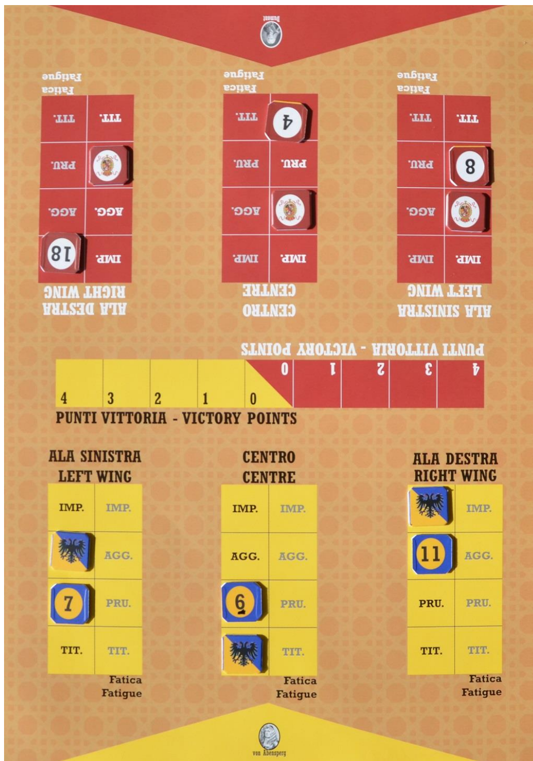
Foto 7 – La scheda per gli ordini alle tre formazioni dei due eserciti: si notano gli ordini attuali e quelli (coperti) del turno precedente.

Poi questi segnalini vengono scoperti e posizionati sulla scheda “Ordini” (che vedete nella Foto 7 qui sopra) in corrispondenza della formazione che li ha ricevuti. A questo punto bisogna: