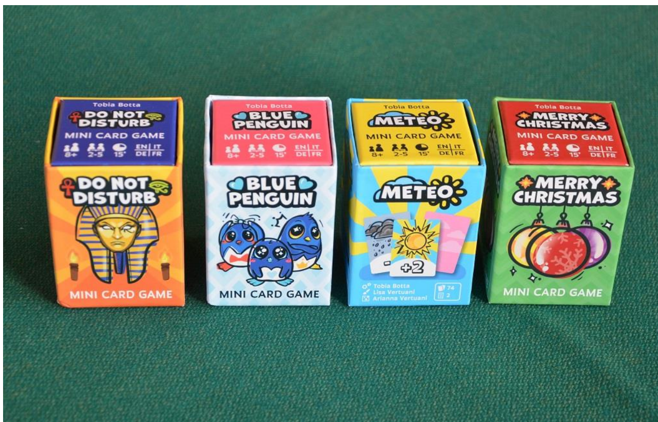
Foto 18 – Le quattro scatoline dei giochi descritti in questo articolo.

Abbiamo esordito dicendo che eravamo stati attirati dalle scatoline di questa nuova “gamma” perché davvero ci dicevano “aprimi, aprimi”: così non solo le abbiamo aperte, apprezzandone la grafica, ma ci siamo anche divertiti a provare tutti i giochi su vari tavoli e con partecipanti di tutte le età.