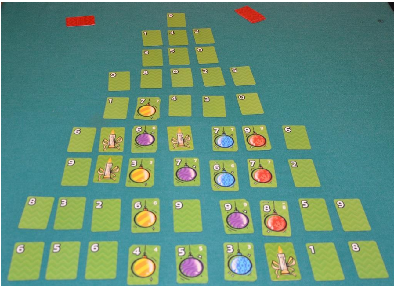
Foto 13 – Partita in corso: notate la carta 6 viola che ha coperto una carta gialla, ma non era l’ultima giocata.

La posa delle carte sull’albero si fa rispettando le seguenti regole: