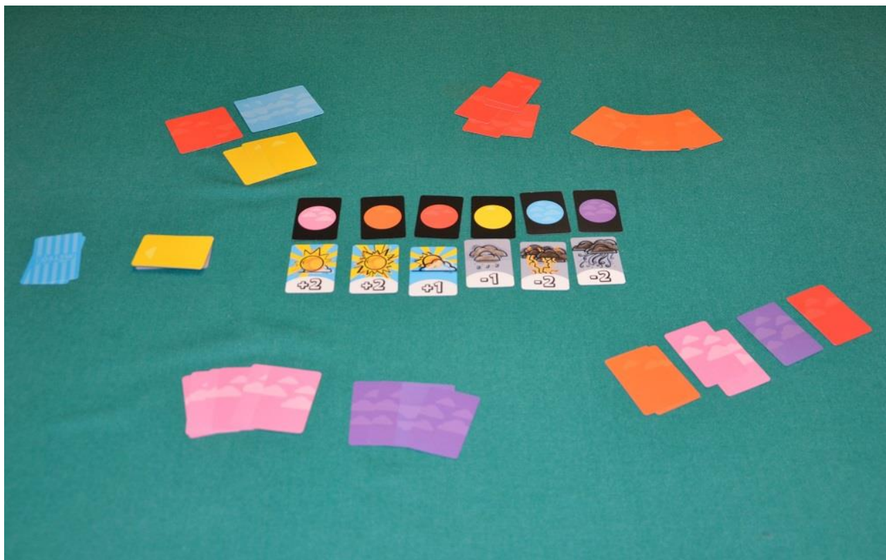
Foto 17 – Siamo a fine partita e si contano i Punti Vittoria (PV)[/caption]

Notare che se vengono scoperte 5 carte sul tavolo e nessuno decide di prenderle, esse vengono scartate e si ricomincia la sequenza.