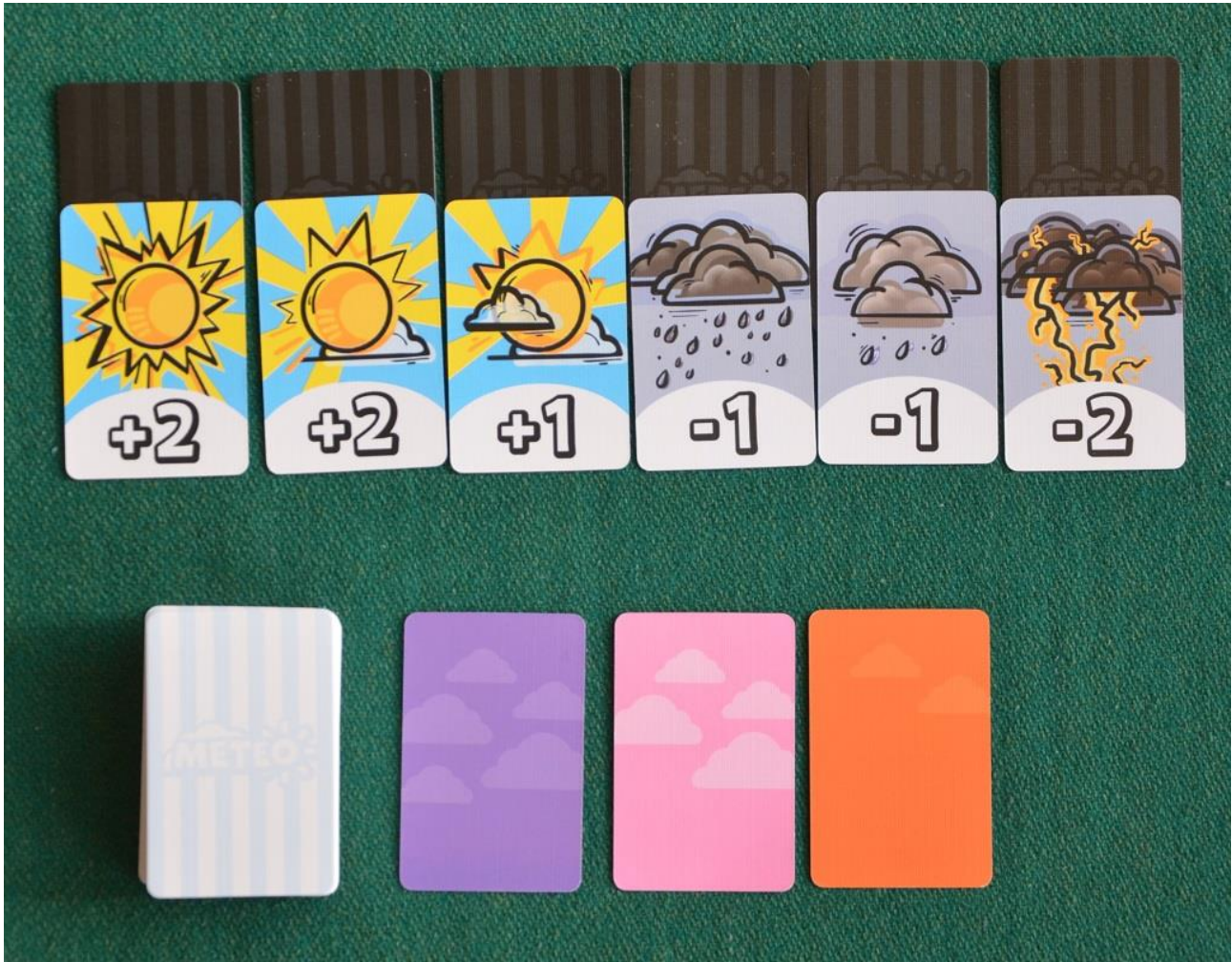
Foto 16 – Setup di una partita a Meteo: le prime tre carte Cielo sono già state girate.

Prima di iniziare stendere casualmente le 6 carte Colore (coperte) in una fila al centro del tavolo, poi pescare 6 carte Meteo a caso, mettendole sopra alle precedenti, in ordine dalla più alta (+2) alla più bassa (-2): per le primissime partite vi consigliamo di utilizzare la sequenza +2/+1/+1/-1/-1/-2.