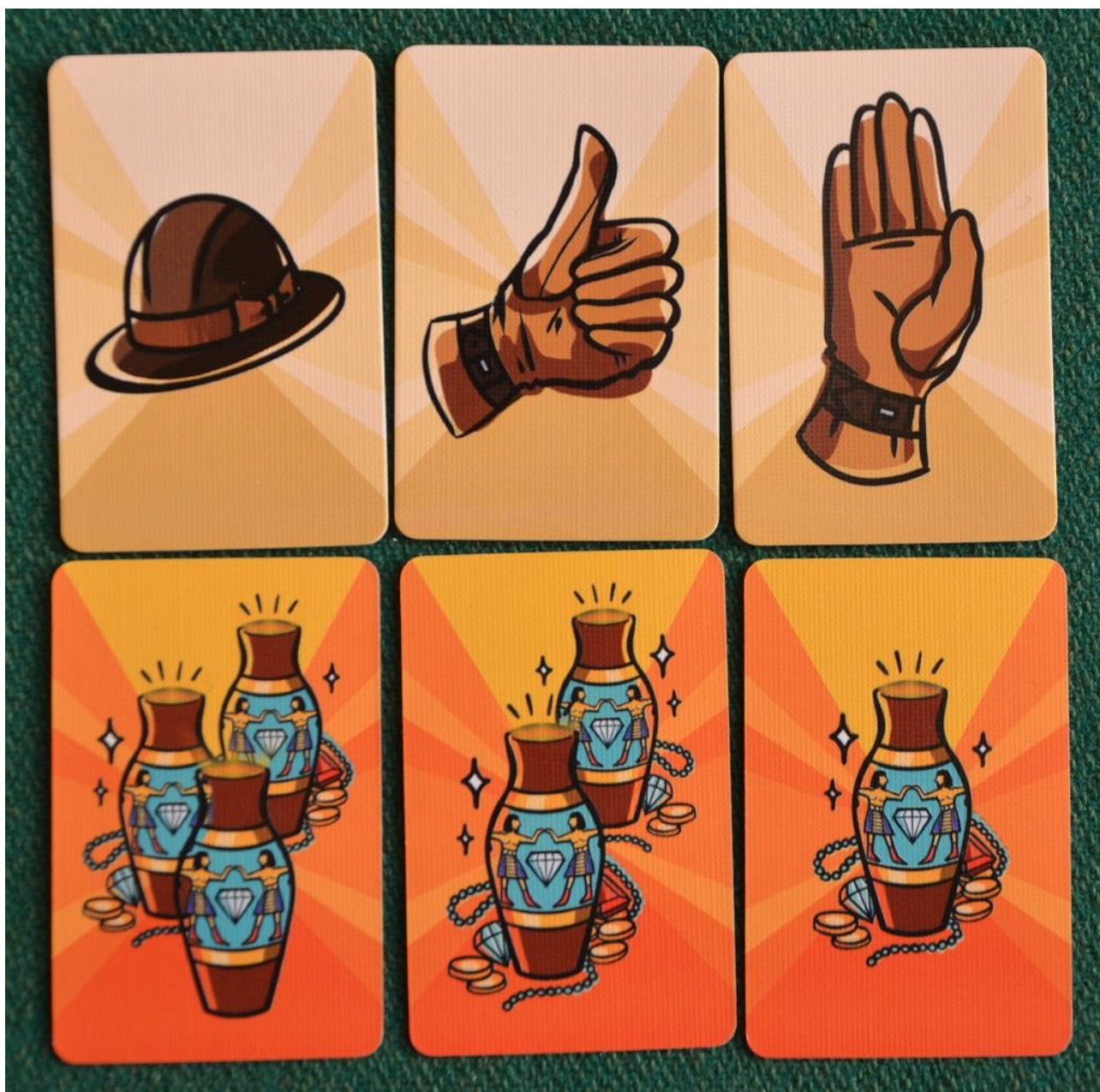
Foto 9 – Dettaglio delle carte speciali (in alto) e di quelle del Tesoro (sotto).

Il giocatore successivo vede quello che avete proposto e controlla che le sue carte confermino o neghino quanto indicato dal compagno: in caso positivo lascia le carte dove si trova, ma se non è d’accordo le può spostare.