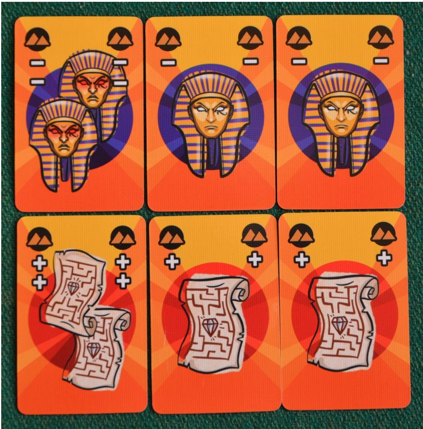
Foto 8 – La seconda faccia delle carte “Esplorazione” che hanno il simbolo delle Piramidi: in alto le maledizioni e in basso gli Indizi.

Do Not Disturb è un gioco “cooperativo” dove però non è permesso parlare né aiutarsi in alcun modo se non manipolando le carte sul tavolo per dare informazioni indirette ai compagni. Le carte in mano non verranno mai giocate, ma serviranno a dare al loro possessore qualche idea sul valore e sul tipo di quelle in tavola.