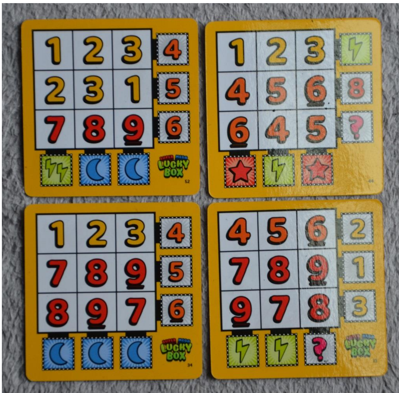
Foto 3 – Alcune carte Mega Grill: notare che a destra di ogni riga e sotto ogni colonna ci sono i “bonus” che si guadagnano completandole.

Queste ultime si marcano direttamente sulla scheda segnapunti e daranno dei PV supplementari.