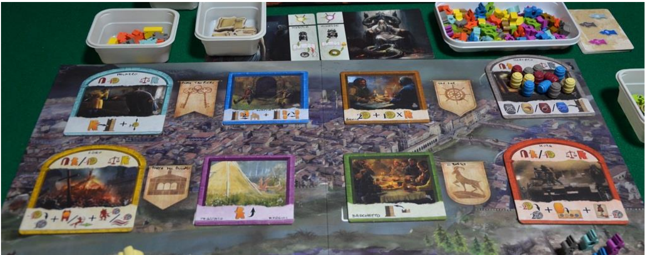
Foto 9 – L’area di Firenze sul tabellone, con 4 Tessere “Luogo Speciale” e quattro “Luogo Franco”).

(A) – Quartiere PORTA SAN PIERO (simbolo: due chiavi):