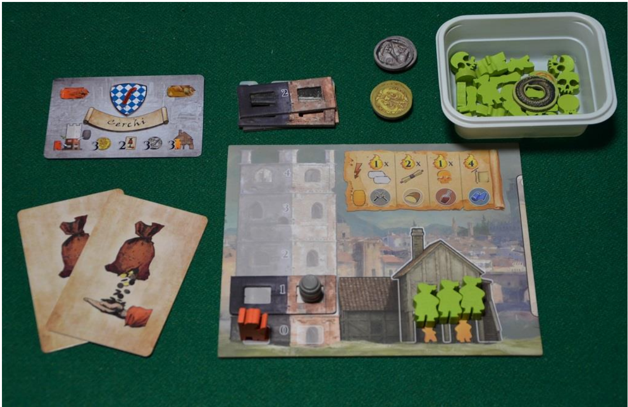
Foto 8 – La postazione iniziale di un giocatore, dove sono state usate le carte “Apprendista” (anziché quelle Famiglia) per l’assegnazione iniziale delle risorse.

Per andare a Firenze e decidere quale azione eseguire dobbiamo avere qualche familiare disponibile: durante la preparazione iniziale le carte “Famiglia” ci indicano: