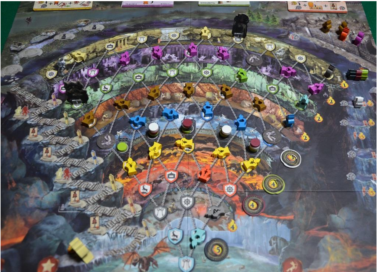
Foto 7 – Ecco come si presentano i gironi infernali verso la fine della partita.

all'inferno devono in effetti pagare una Dracma (fate attenzione, anche in questa recensione, alla differenza fra queste monete e i Fiorini).