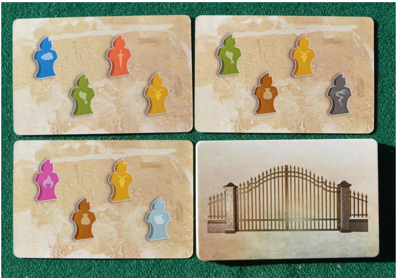
Foto 6 – Le carte “Peste” indicano le anime arrivate “fresche fresche” al Cimitero.

(B) – Eseguire un’azione a Firenze, ma attenzione, si potrà posare uno dei propri segnalini (Nobile o Monello) su una tessera del quartiere che ha lo stesso simbolo della casella infernale su cui si è appena mossa l’anima (uno stambecco, un timone, due chiavi o un edificio). All’inizio è cosa facile, ma in seguito, con le caselle che man mano si riempiono, diventa necessario saper cambiare strategia al volo e ripiegare su azioni alternative.