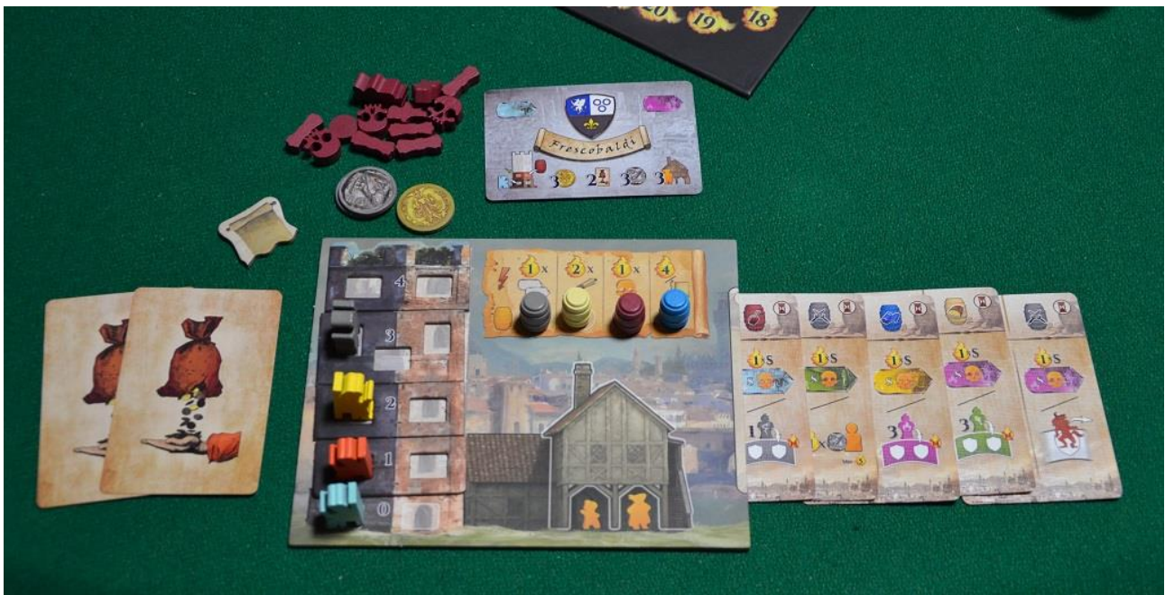
Foto 13 – L’area personale durante una partita: il giocatore ha completato la sua Torre e ha portato sulla plancia tutti e quattro i Notabili e i Barili, quindi a fine partita potrà risolvere positivamente tutte le carte Imbroglia che ha sistemato a destra.

Non dimenticate poi che accusare un peccatore nei Luoghi Speciali richiede la presenza dei Notabili di un certo colore sulla vostra Torre: quindi date la precedenza a quelli che hanno il colore del tracciato Peccato su cui avete un teschio.