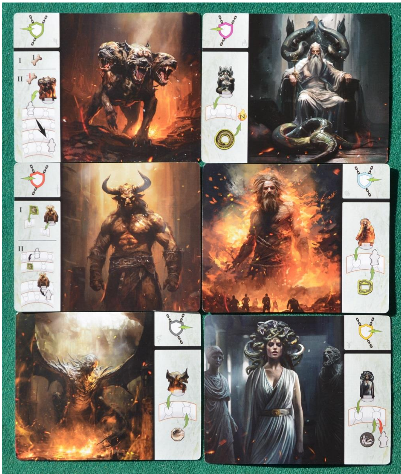
Foto 14 – Le carte con le caratteristiche dei Guardiani: ognuno di essi è rappresentato sul tabellone da un segnalino in bassetta.

Cercate di recuperare tessere “mezzo Diploma” (arrivando a fine percorso sui tracciati del Peccato o con le carte Imbroglia) perché ogni coppia permette di mettere, a fine partita, 1 segnalino Diploma su un tracciato a scelta nell’area Peccato, abilitando quindi il relativo punteggio: di solito i giocatori, giocando con accortezza, riescono ad accumulare almeno 4 mezze-tessere di quel tipo e quindi potranno fare PV in più tracciati.