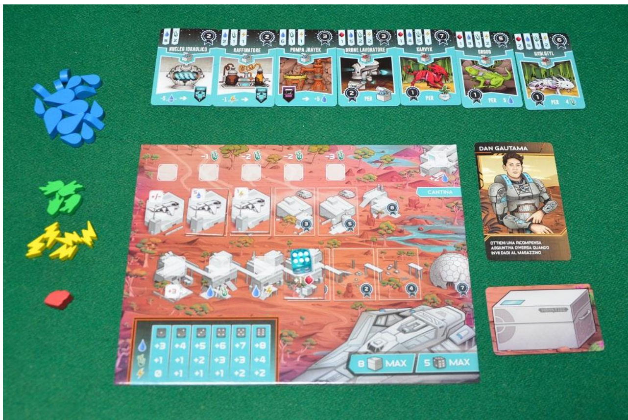
Foto 11 – La quantità di risorse che le fattorie possono generare dipende dal valore del dado che si utilizza.

Da quanto vi abbiamo appena raccontato si ricava che Circadians: Prima Alba è un titolo abbastanza impegnativo per giocatori esperti: le scelte da fare ad ogni round sono importanti e devono essere quindi studiate attentamente perché una volta piazzati i dadi e tolto lo schermo non si può più cambiare idea e se avete sbagliato i vostri conti rischiate di perdere azioni e tempo.