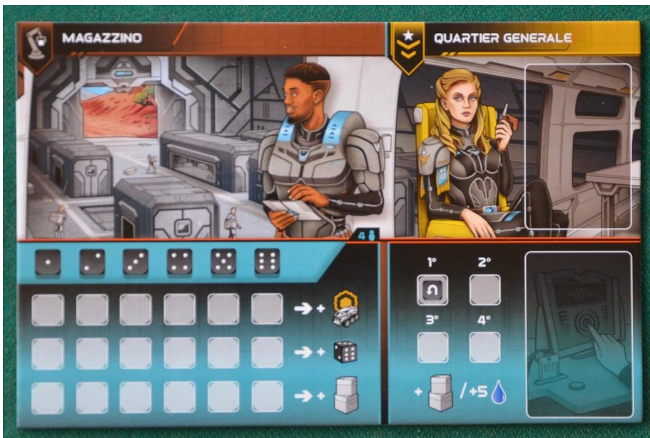
Foto 6 – La plancia Spazioporto con le due aree Quartier Generale e Magazzino.