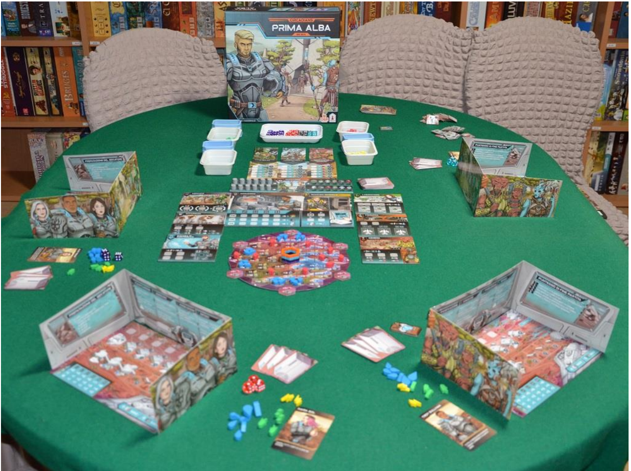
Foto 2 – Panoramica di un tavolo pronto per una partita a quattro.

Per giocare a Circadians: Prima Alba , serve un tavolo abbastanza grande e la preparazione iniziale richiede un po' di tempo, essendo piuttosto elaborata: assicuratevi di arrivare al club almeno un'oretta prima dell'orario stabilito per far trovare tutto pronto ai vostri amici.