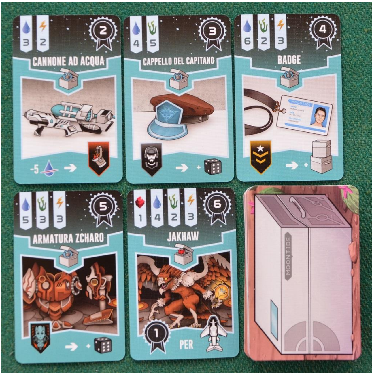
Foto 10 – Esempio di carte Contratto: il costo per realizzarli è indicato in alto a sinistra.

La partita a Circadians: Prima Alba termina con il settimo round, come abbiamo già anticipato, e tutti contano allora i PV accumulati con: