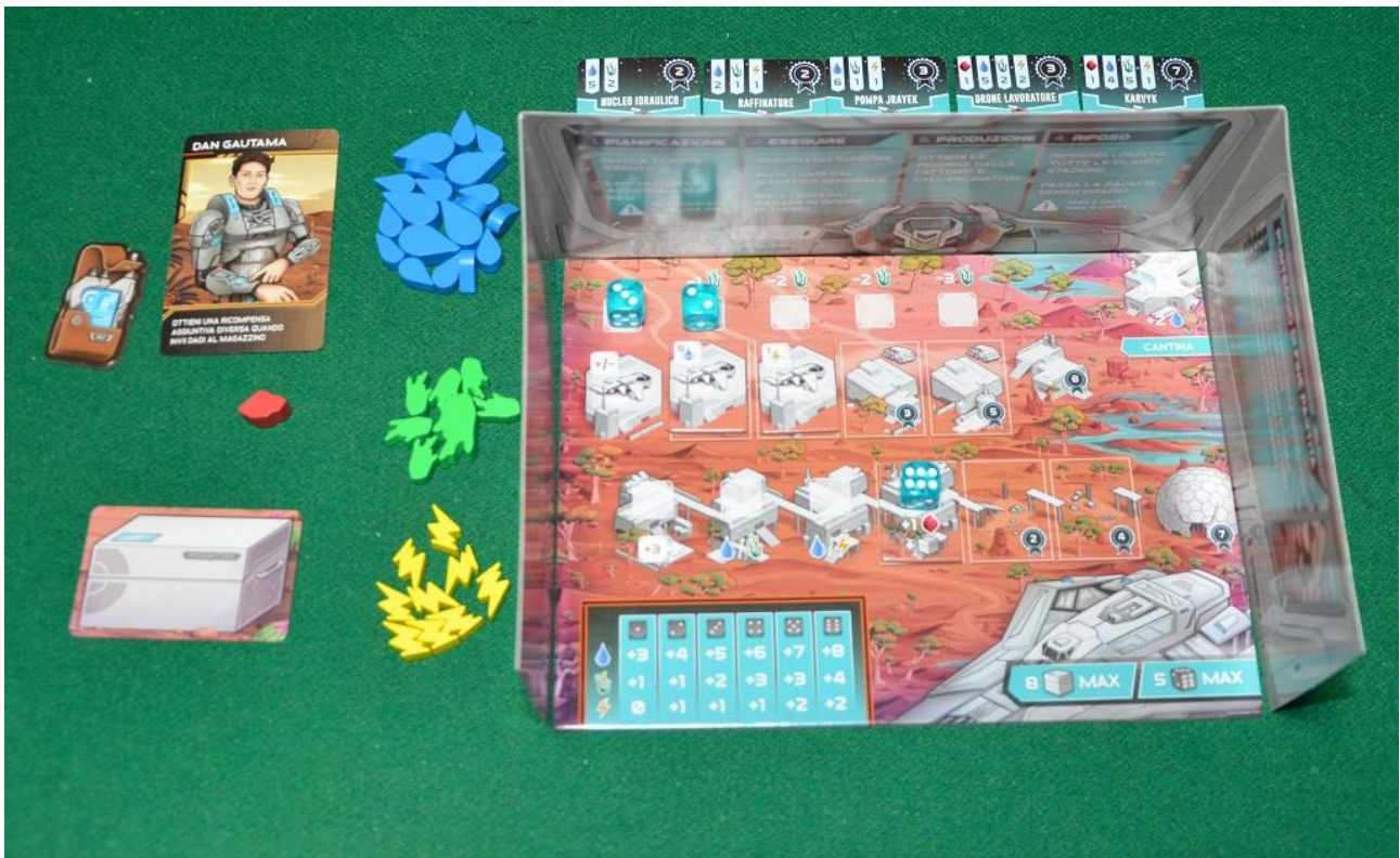
Foto 5 – La postazione di un giocatore durante la partita: notare che ha posato due dadi sulle navicelle e il terzo su una fattoria.

Le azioni a disposizione dei giocatori di Circadians: Prima Alba sono nove, e ve le riassumiamo brevemente qui di seguito: