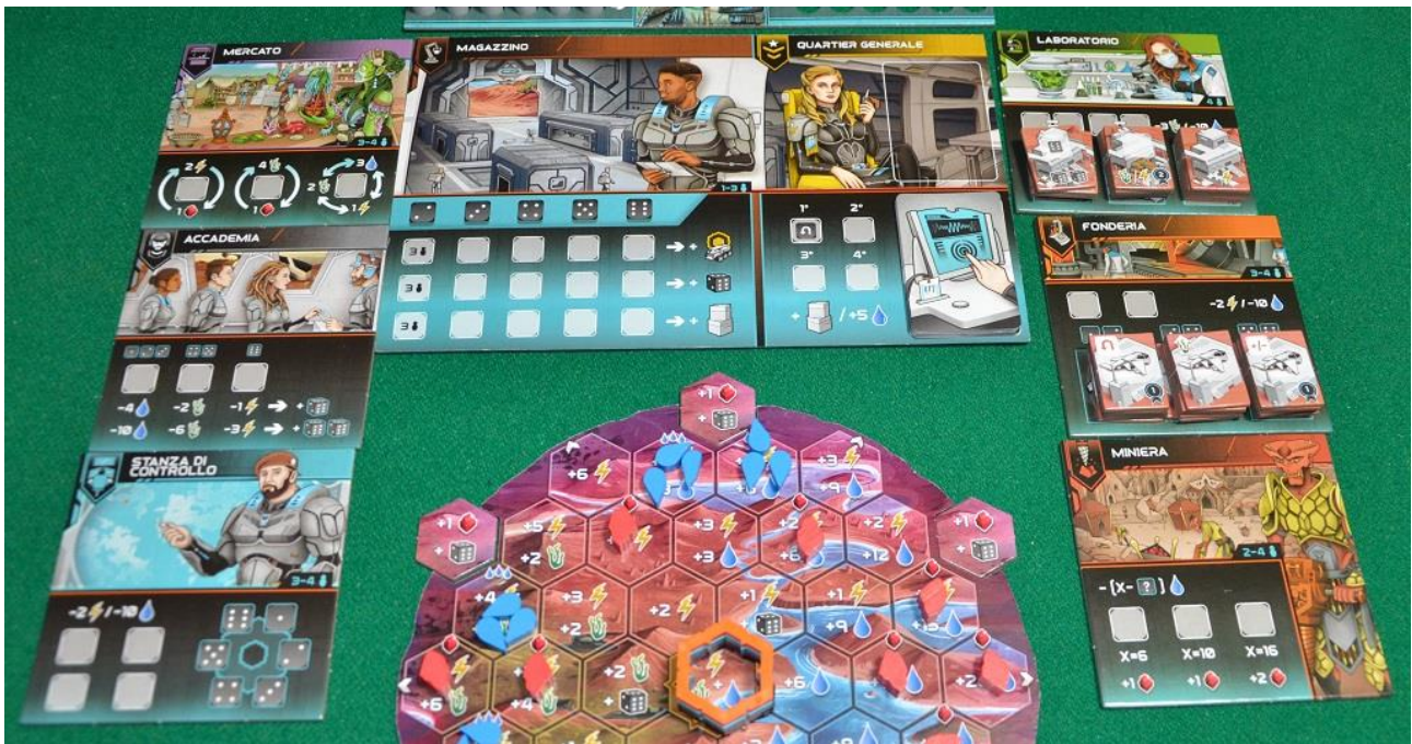
Foto 7 – Le tessere Stazione: Mercato, Accademia, Stanza di Controllo, Laboratorio, Fonderia e Miniera.

(9) Negoziazione: Anche questa è un'azione molto importante per Circadians: Prima Alba perché circa un terzo dei PV che i giocatori faranno potrebbe provenire proprio da qui. I dadi inviati a questa plancia però non torneranno più indietro fino al termine della partita, proprio come quelli del Magazzino.