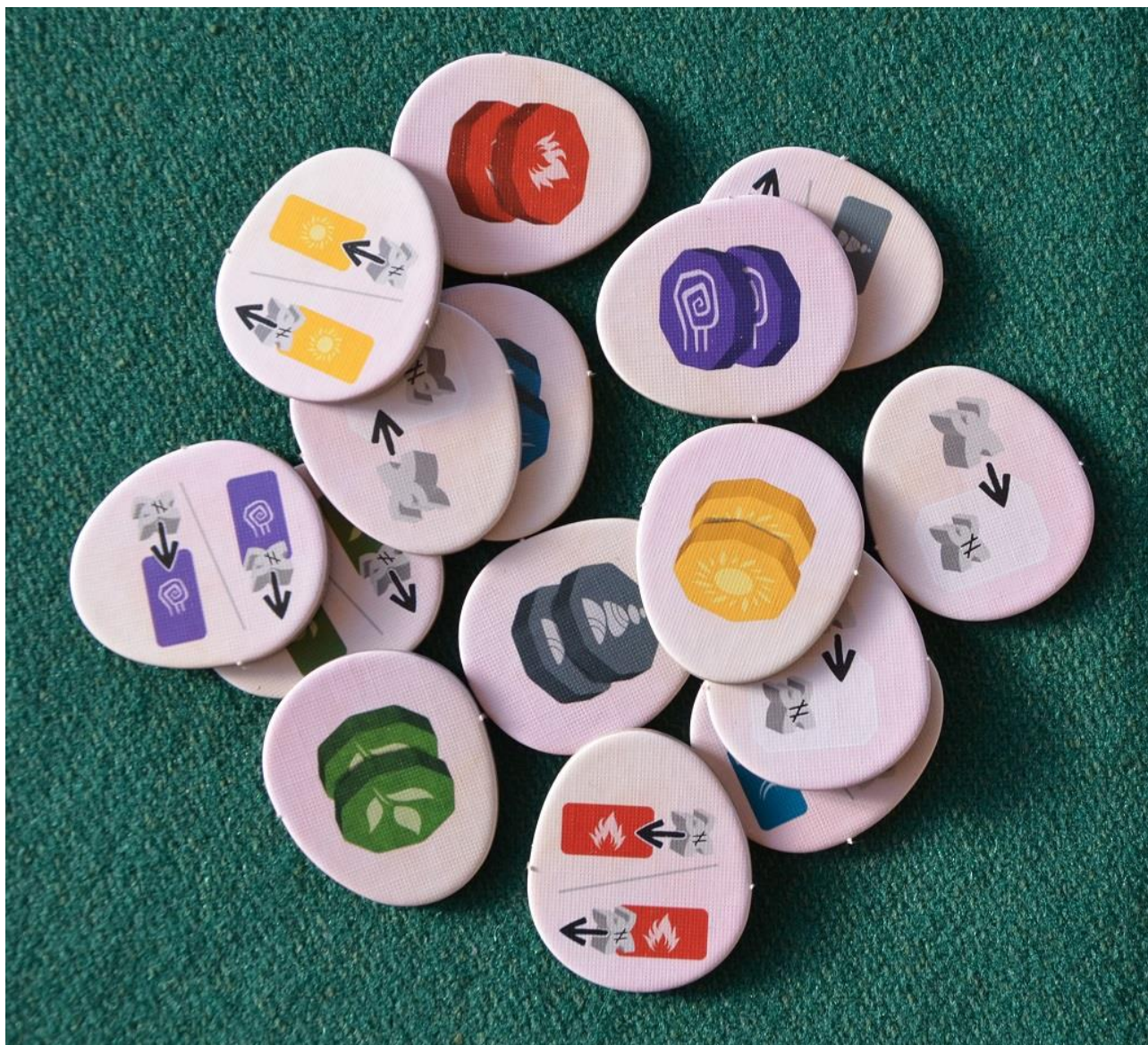
Foto 10 – I gettoni “Runa” che possono essere incamerati durante la partita.

Non dimenticate mai, durante una partita a Inori , di riguardare ogni tanto il colore delle tessere Altare nelle prime 3 caselle del Grande Albero: esse infatti garantiscono 10-8-6 PV extra, a fine partita, a chi ha più tessere con quei colori, ma durante il gioco avere 5-6 Favori in certi colori permette comunque di fare altri PV (anche più volte in partita) se si scelgono le caselle giuste sulle carte.