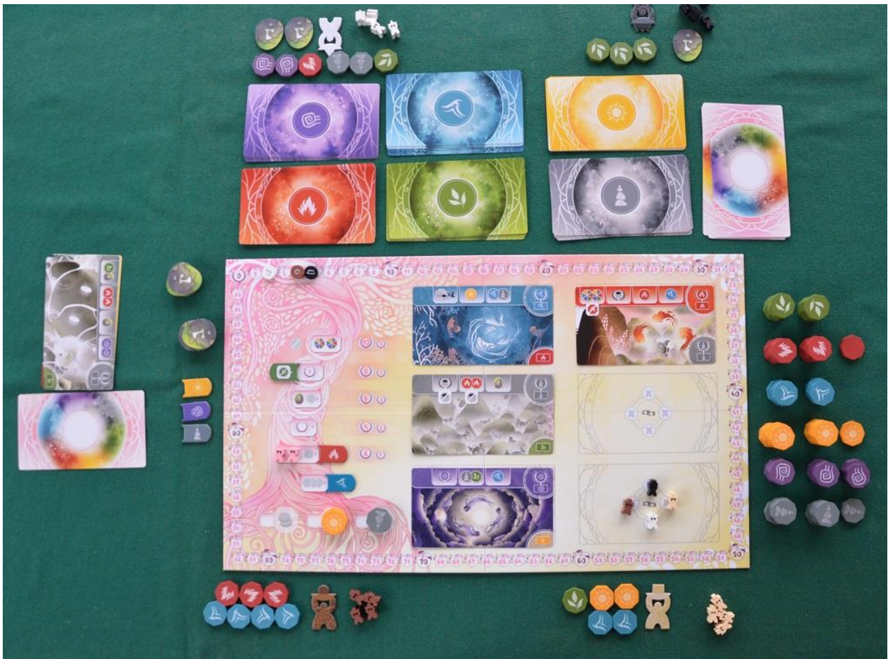
Foto 8 – Ecco come si presenta il tavolo al termine del secondo round di una partita.

- nessuno invece prende punti per la terza carta, perché è incompleta e verrà sostituita da una di colore viola.