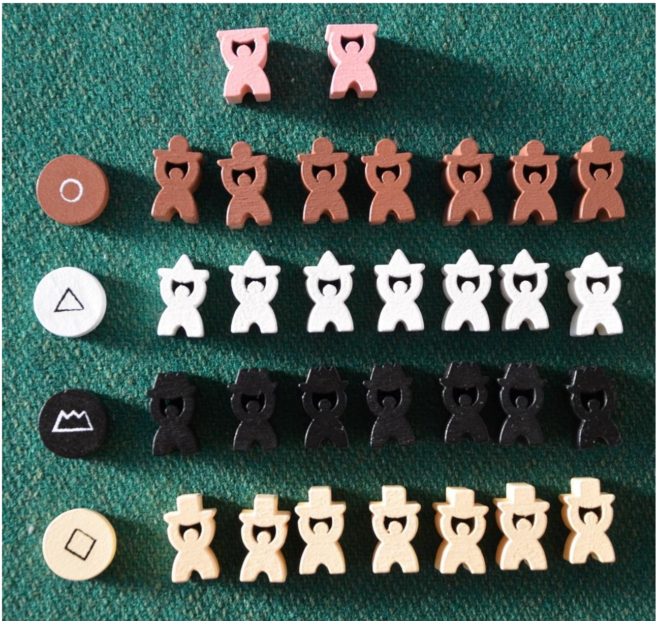
Foto 12 – I segnalini dei giocatori: a sinistra i gettoni per il tracciato dei Punti Vittoria, mentre a destra ci sono gli Adepti.

Ma è sicuramente con giocatori di una certa esperienza che le partite si fanno più appassionanti e competitive: qui non ci si accontenta più soltanto di accumulare tessere per poi fare punti, ma tutti cercheranno sempre di ostacolare gli avversari e di marcarli “a vista”: