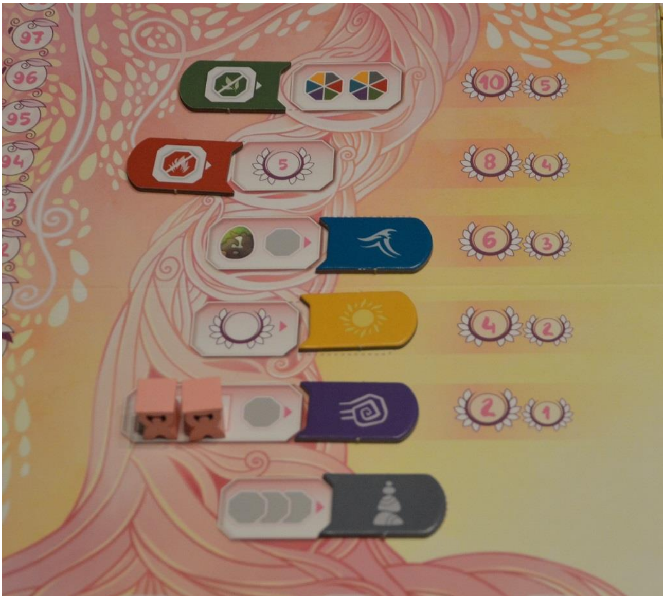
Foto 9 – Il Grande Albero di Inori alla fine di una partita: i punti che assegna sono indicati a destra.

Nell'esempio della Foto 9 qui sopra avremo: